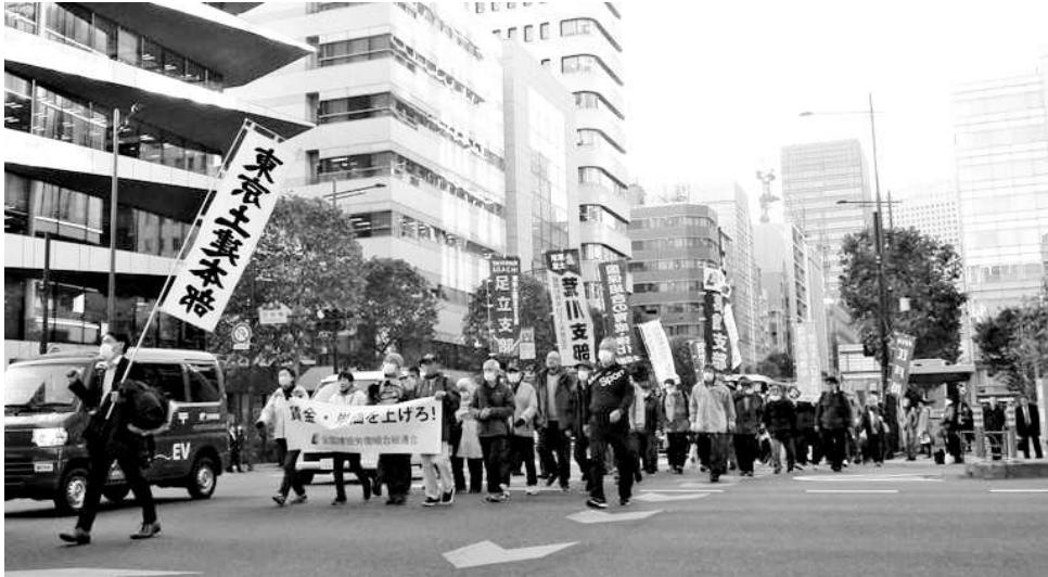
ニッショーホールから新橋駅までデモ行進

〒124-0012 葛飾区立石8-34-4 電 話 (5698) 1 2 6 1 FAX (5698) 1 2 6 2 発行人 関 根 伸 正