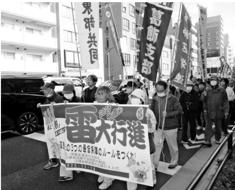
浅草で世論に訴えながら行進

浅草で世論に訴える雷大行進。今年は11月16日(日)に開催しました。当日は東京土建は葛飾支部から22人の参加をはじめ、浅草近隣の東京土建の足立・荒川・台東・墨田・江戸川・江東支部からの参加、また、この大行進に賛同する各方面の団体、議員の皆さん含め、500人が参加しました。