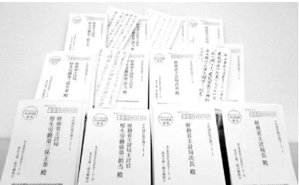
集まった予算要求ハガキ