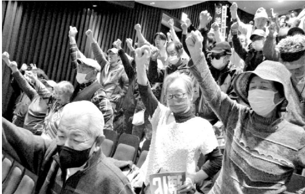
団結ガンバロウで意思統一