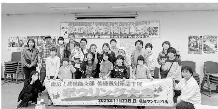
ボウリング大会最後にみんなで集合写真

参加者はみんな笑顔で楽しかったと言ってくれました。次回行うレクレーションも、楽しい企画になるよう、後継者対策部のみんなで話合っていきます。