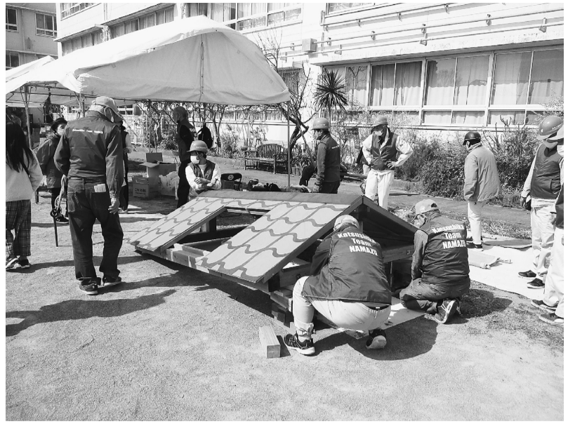
倒壊家屋からの救出訓練