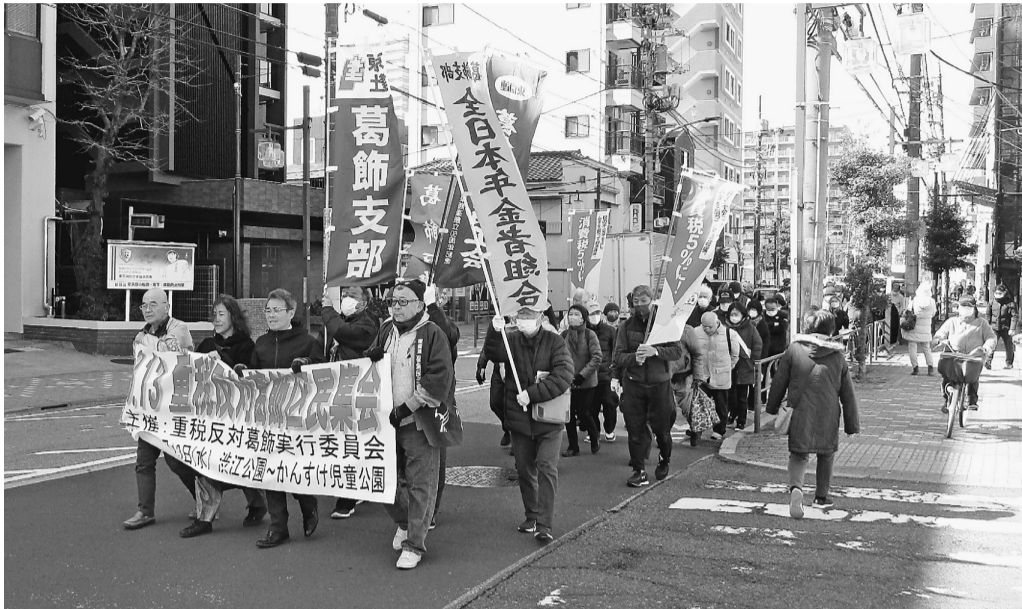
渋江公園から税務署まで

〒124-0012 葛飾区立石8-34-4 電話 (5698) 1 2 6 1 FAX (5698) 1 2 6 2 発行人 関根伸正