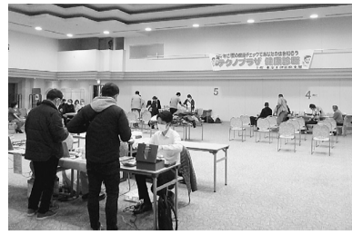
テクノでの集団健診

2024年2月25日にテクノプラザかつしかで支部集団健診を実施しました。当日はあいにくの天気となりましたが、216名の仲間の受診と久しぶりに200名を超える多くの方が受診され、健康意識の高まりを実感する健診になりました。