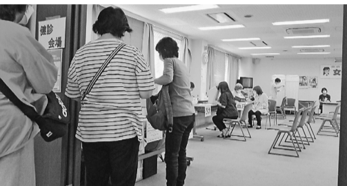
葛飾支部会館で実施

当日の健診受診者は35名でした。次回の集団健診は、8月20日にテクノプラザかつしかで行います。