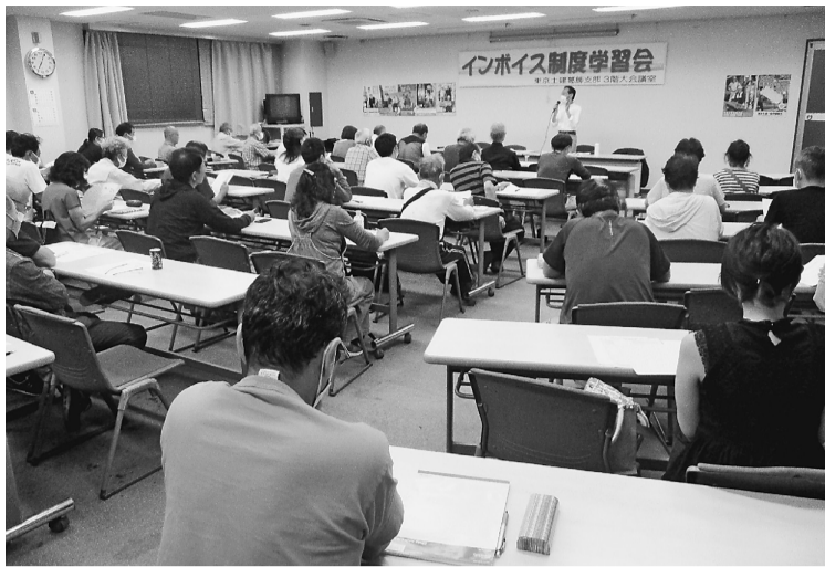
60人が参加した学習会

習会の内容となりました。学習した組合員からは、「自分が導入しないといけないのか判断するのが難しい」「課税業者として、免税業者にどう説明したらいいのかわからない」などの制度の難しさで混乱していました。 インボイス制度自体、国しか得しない制度になっており、だれもこの制度によって助かる人はいません。むしろ、中小業者いじめとも言われているものです。10月1日に国は導入予定と言われていますが、まだ始まってはいません。東京土建では、インボイス制度導入中止を求める署名・運動に取り組んでおります。群会議で署名の取り組み・中止を求める運動の参加をぜひよろしくお願いいたします。また、インボイスのご相談は支部までご連絡ください。