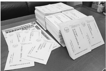
集まった厚労省宛要請ハガキ