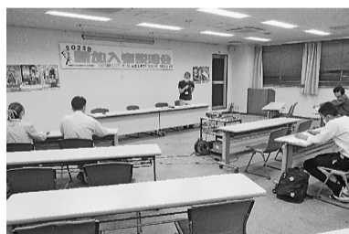
4人が参加した説明会

6月22日(木)夜、葛飾支部会館で新加入者説明会を開催しました。参加対象は今年1月から6月までに加入した組合員。新加入者した組合員がどんなことを利用できるのか、組合自体がどんなことを運動しているのか、所属している分会・群についてなど、映像を交えながら説明会を進めました。この説明会は今年度より初めての試みで、教育宣伝部が行っています。