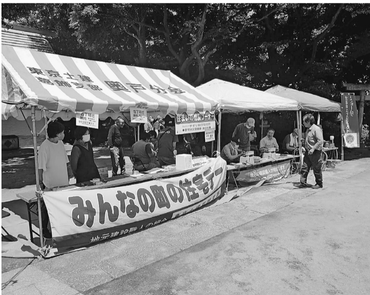
奥戸分会住宅デー 包丁研ぎで131丁の依頼