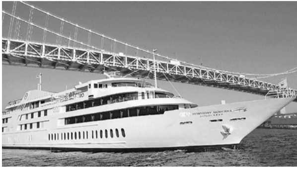
クルーズ船 (イメージ)