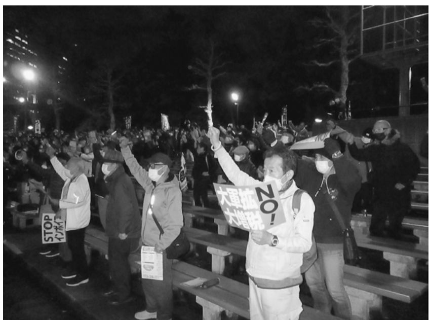
集会で声をあげる葛飾から参加のみなさん

増税、物価高騰など私たちの生活が厳しい状況が続く中、3月28日(火)18時から、緊急で『もう黙ってはいられない！生活危機突破3・28決起集会』を日比谷野外音楽堂で開催しました。全体で1000人の参加で、葛飾支部からは32人の参加でした。