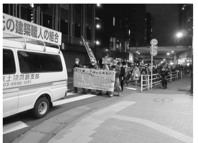
東京駅までデモ行進

集会では、国会議員、共闘団体からのあいさつ、業界からの現状の生活に対する改善を求める訴えがありました。その後、集会決議案の提案では、①国民的議論がないままに勝手に決める防衛費増額と大増税に反対します、②消費税の減税など、国民生活を直接支援する政策を求めます、