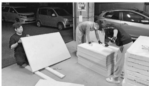
青年部のデコ作成