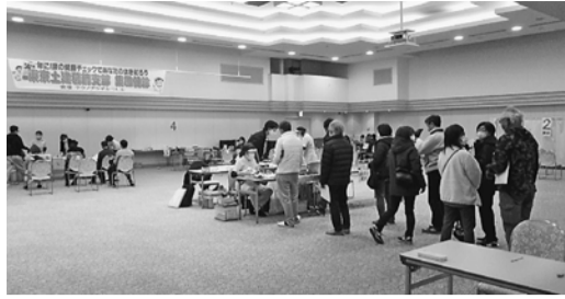
2022年度最後の集団健診