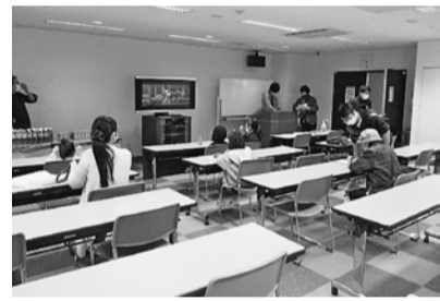
後継者対策による休憩室