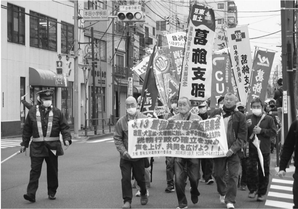
渋江公園から葛飾税務署へ（奥戸街道）

〒124-0012 葛飾区立石8-34-4 電話 (5698) 1 2 6 1 FAX (5698) 1 2 6 2 発行人 関根伸正