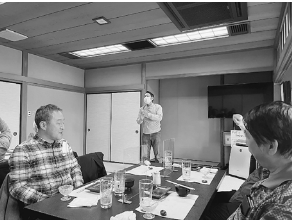
和楽亭で新年会を開催