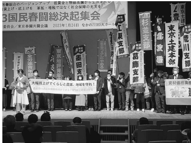
なかのZEROに626人が集まった春闘集会

はじめに主催者から「世間的な物価高を受け、世界各地方で賃上げの声が上がっている。フランスでは100万人を超える集会とデモ行進が行われた。今こそ日本でもストライキを含め賃上げを訴える春闘にしよう」と基調報告がありました。