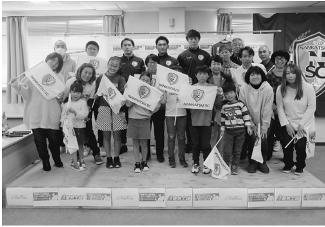
南葛SCの選手と記念撮影