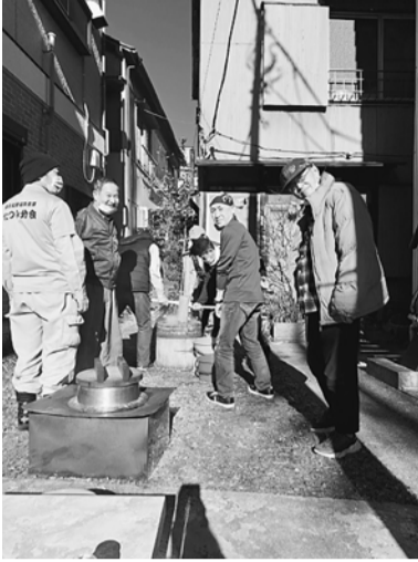
たつみ分会餅つき

餅が付いたまま上がって地面に落ちてしまいました。水で洗おうと試みましたが小石が取れず、一回分が無駄になり、のし餅数枚分が作れなくなりました。残念でした。気を取りなおして餅つきを終わらせた後は、分会センター内で忘年会。餅だけでなく、ピザやお好み焼き等も準備し、みんなでお酒を楽しみました。20人弱でしたがわいわい楽しい1日でした。