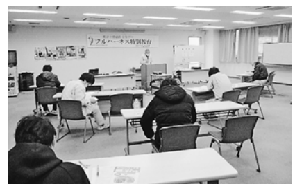
間隔を取りながらの受講