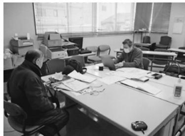
初めての事前確認登録会

響で去年11月から今年3月までのいずれかの月の売り上げが過去3年間の同じ月と比べ30%以上減少した中小企業と個人事業主です。申請には登録確認機関による事前確認が必要となります。