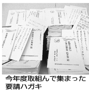
今年度取組んで集まった要請ハガキ