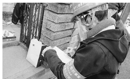
現場での聞き取り調査

3月末は新年度の保険証交付の時期です。分会ごとに交付日時が異なりますので、2月の群会議で役員さんにご確認をお願いします。当日、受け取りに行けない方は、役員さんもしくは、葛飾支部へご相談ください。 新年度の保険証は、未納や滞納があると受け取れません。3月に納入する4月分までの組合費・保険料の納入が必須です。未納や滞納がある方はご注意ください。納入状況は支部までお問合せください。 毎年、保険料の改定が行われます。新年度の保険料については、3月上旬に土建国保に加入の組合員のみなさんへ案内が届きますので、ご確認ください。保険料の改定については、次月の新聞でお知らせします。