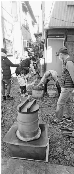
2年ぶりのもちつき

【たつみ 村越通信員】12月19日（日）たつみ分会で、餅つきを行いました。昨年は中止の為、2年ぶりですが、しかもコロナ禍での小規模な開催になりましたが、役員中心で賑わいました。参加は16人です。その後分会センター内で懇親会を開いて楽しい1日を過ごしました。