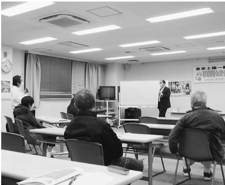
様々な質問ができました