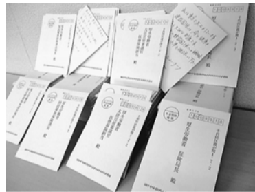
厚労省宛要請ハガキ

新型コロナウイルスの終息の目途が立たない状況ではありますが、来年度の建設国保補助金獲得の運動は私たちの建設国保を守るうえでも必要な取り組みとなります。医療保険一元化阻止と建設国保育成・強化の運動として、建設国庫補助金現行水準確保の取り組みハガキ要請行動を多くの組合員の力で進めていく