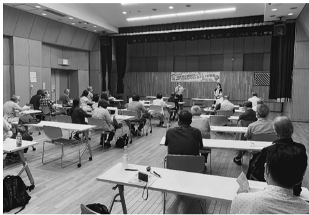
亀有リリオに28人が参加

されるインボイス制度についての学習会を開催し、28名が参加しました(土建から6人が参加)。