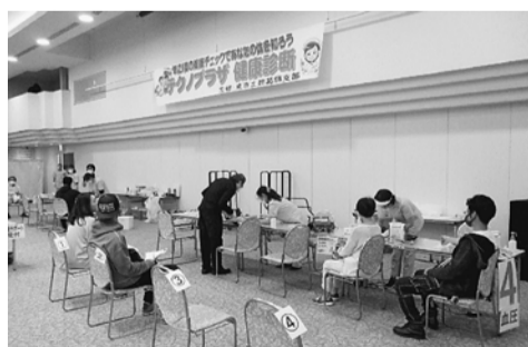
関根教育宣伝部長

前回と同様に支部集団健診から健診と特定保健指導を同じ会場で行いました。会場で、保健師と面談をし、一定