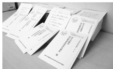
集まった要求ハガキ

みんなができる予算要求の取り組みのハガキ要請行動は、現在5658枚（7月29日現在 昨年は7738枚）。新型コロナウイルスへの対応を迫られる日常生活の中、組合員と家族の協力のもと123%の達成率で推移しています。改めてご協力ありがとうございます。200%達成分会は、たつみ・奥戸・