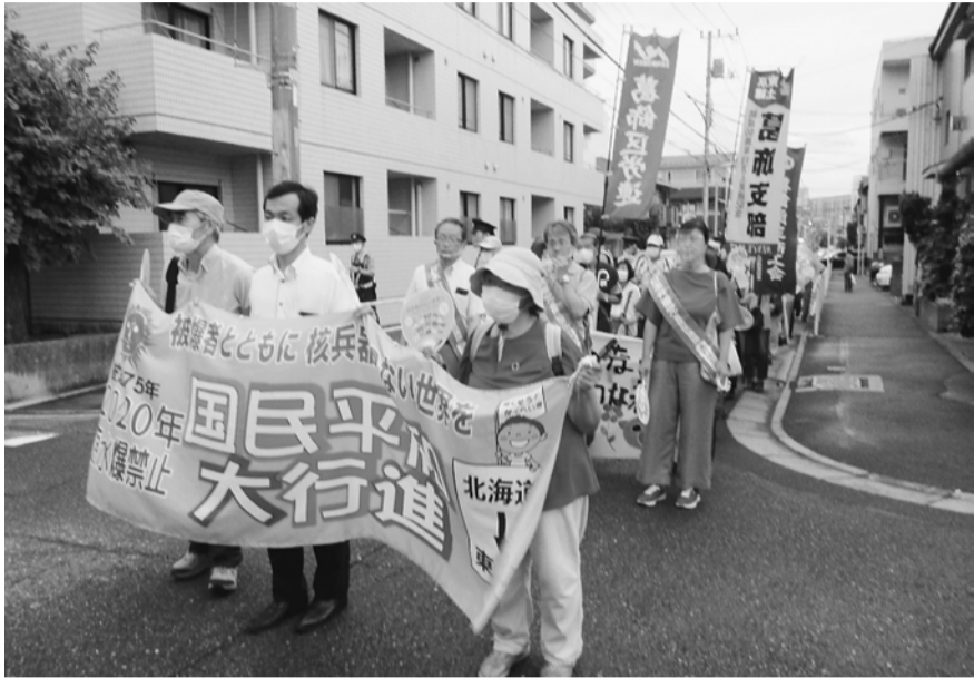
東新小岩から青戸平和公園へ平和大行進

れている原水爆禁止世界大会は、1955年から続いています。東京土建は今まで積極的に参加をし、葛飾支部でも毎年3人の代表派遣をし、平和への運動を重ねてきました。 今年は被ばくして75年です。被ばく75周年原水禁世界大会は、開催はするものの、新型コロナウイルスへの対策のため、異例の対応を迫られ、オンラインでの開催となっています。