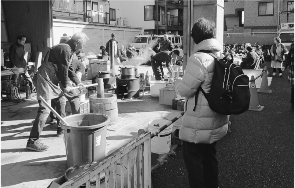
まめに交代しても、つき手は大変でした

1月19日(日)、後継者対策部主催のもちつき交流会が行われました。会場は、葛飾支部会館の駐車場です。3年ぶりに開催したもちつき交流会。以前開催した時の状況を思い出しながら、準備や打ち合わせをしました。おもちは、きなこ、あんこ、いそべ、納豆の4種類の味を