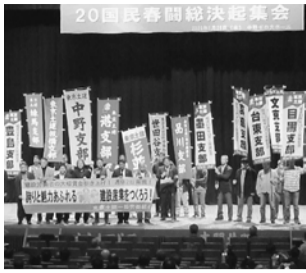
葛飾支部も代表が登壇

3月末は新年度の保険証の交付時期です。分会ごとに交付日時が異なります。2月の群会議で確認をお願いします。当日、受け取りに行けず。2月の群会議で確認をお願いします。新年度の保険料については、3月上旬にご案内が届きますので、ご確認ください。保険料の改定については、新聞でもお知らせいたします。