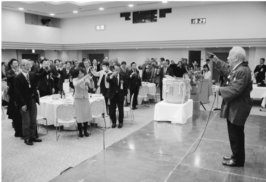
横田建長会会長より、乾杯

第67回支 部定期大会 は、2020年4月12日(日)午前9時半より、テクノプラザかつしかにて開催します。 ◆代議員および特別代議員定数について 2020年2月1日付人員 (1月24日登録人員) で定数を確定します。 ○代議員 基礎代議員1人に加え、分会人員40人に1人(端数2人以上で1人追加) 青年部・女性の会・建長会より各1人 ○特別代議員 1分会・青年部・女性の会・建長会より各2人 ※支部四役、常任執行委員、執行委員も分会代議員数の中に含まれます。