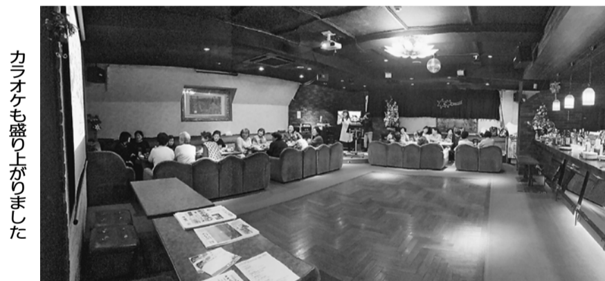
カラオケも盛り上がりました

例年は幹事さんのみの参加でしたが、今年も新たな幹事さん候補や分会で女性の会を支えてくれる会員さんにも声をかけて参加者を募りました。