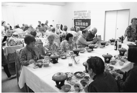
食事と会話を楽しみました

途中からは、幹事さんのカラオケや曲に合わせたダンスも始まりました。大賑わいの新年会となりました。