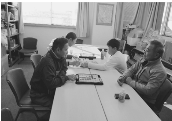
将棋とオセロ、それぞれで対戦

11月30日(土)、葛飾支部会館の3階で、支部厚生文化主催の将棋・オセロ交流会を開催しました。参加者は、4人でした。毎年、本部主催の将棋大会の前に行っていました。本部では、12月8日にオセロ大会を開催します。その前に交流会を開催しました。