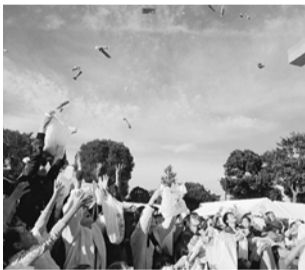
お菓手に手を伸ばし

住宅まつりの最後の催しは、舞台前で行われた上棟式とお菓子まき。今年は、多くの人が集まりました。今回の総監督は及川副執行