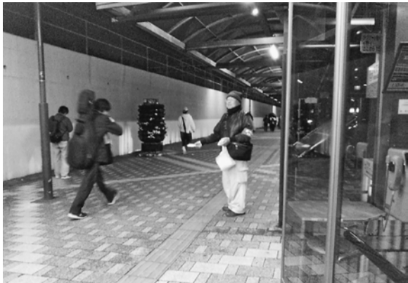
チラシ入りティッシュを配りました

11月25日(月)、定例の消費税反対の駅頭宣伝を行いました。場所は、金町駅です。10月より、消費税が10%になりました。消費税は、低所得者ほど負担が重くなる逆進性を持った税制で、今後は一層低所得者が苦しくなるのを目に見えています。今回は、「消費税増税は許さない」、「消費税を5%に引き下げよ」と訴えました。葛飾支部からは11人が参加し、全体では5団体26人で、1500個のティッシュを配布しました。