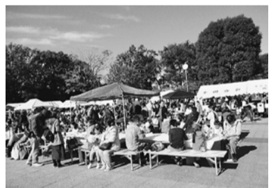
購入後は座って食べられます

各分会は模擬店を出店。焼きそばや野菜販売のほか、新たな取り組みをした模擬店もありました。