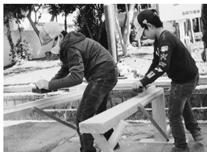
上手に削れるかな