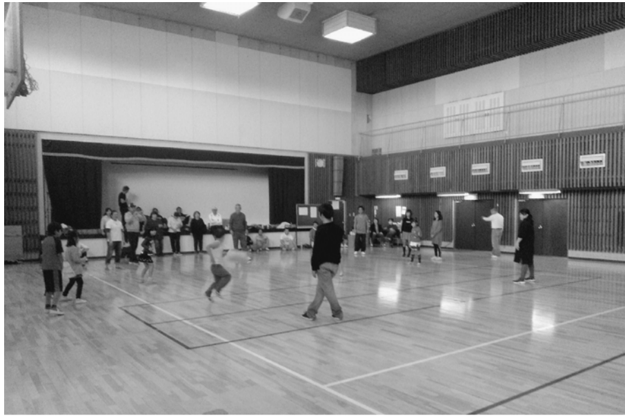
力いっぱい投げました

11月25日(月)、定例の消費税反対の駅頭宣伝を行いました。場所は、金町駅です。10月より、消費税が10%になりました。消費税は、低所得者ほど負担が重くなる逆進性を持った税制で、今後は一層低所得者が苦しくなるのを目に見えています。今回は、「消費税増税は許さない」、「消費税を5%に引き下げよ」と訴えました。葛飾支部からは11人が参加し、全体では5団体26人で、1500個のティッシュを配布しました。