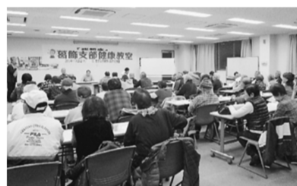
たくさんの人が参加しました

後継者対策部の休憩スペースでは、子どもたちが映画を見て待っていました。第3回は、2020年3月8日の予定です。まだ受けていない方は、ぜひ受診を。