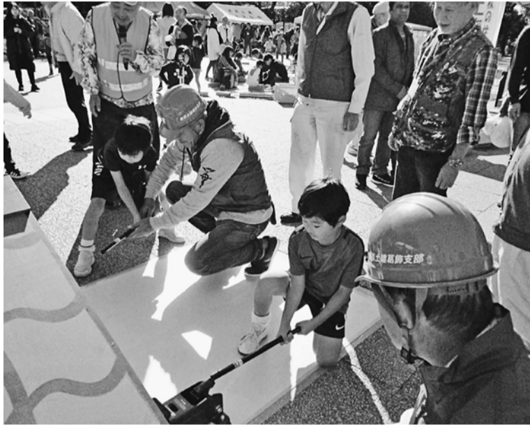
ジャッキは呼吸を合わせて、高さをそろえて持ち上げます

訓練が終わると、毛布1枚と手すり2本で作る簡易担架で運ばれる体験やジャッキで屋根を持ち上げる体験の参加を呼びかけました。こちらには、子どもたちが参加してく