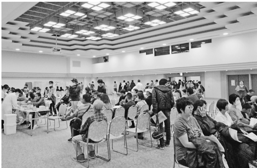
多くの人が受診しました

葛飾支部には、約4500人の組合員が所属しています。そのうち、土建国保には3600人ほどが加入し、8割の人が利用しています。多くの人が利用している土建国保には、いろいろな制度や取り組みがあります。しかし、利用者が少ない、制度を知られていないといったものがあります。