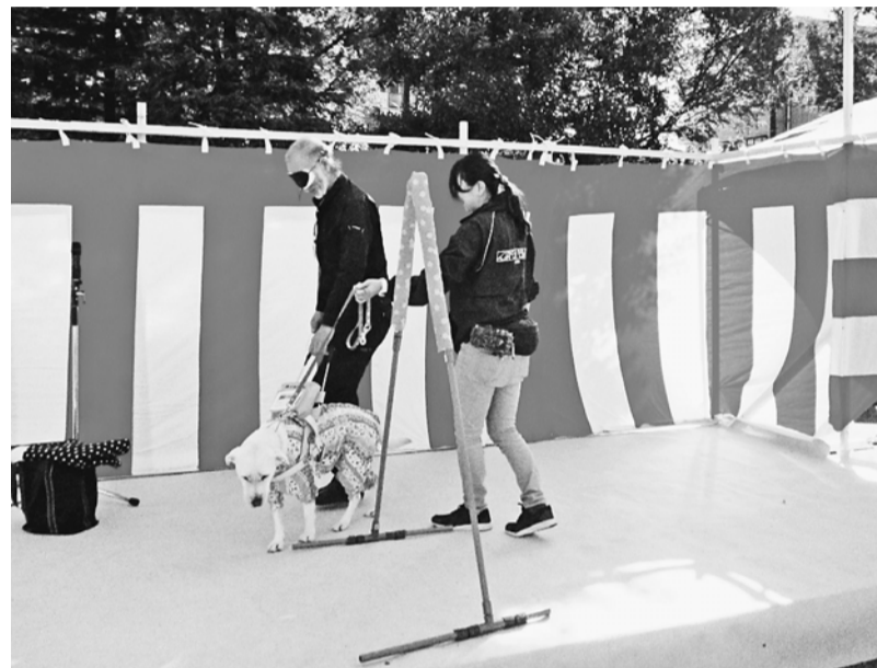
盲導犬が障害物でもきちんと避けてくれます

11月17日(日)、青戸平和公園で、秋の「住宅まつり」を開催しました。晴天に恵まれ、当日は1000人が来場しました。