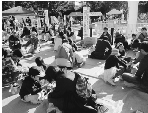
親子でたくさん参加

今年は、木工の材料を着色。白、黄、赤、青と作り上げると鮮やかです。会場内でも作品を持っていると、目を引きまわりました。そのおかげか、工作教室にはたくさんの方が来てくれました。一時、受付を中断することほどでした。