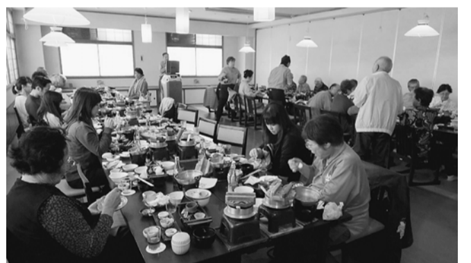
食事を楽しみました

砂浜に降りて、晩秋の海を楽しみました。入館後は、入浴、懇親会で懐石料理お酒カワオケも楽しみ、帰りのバスに乗った後は造り酒屋と道の駅に寄って大きな渋滞にもあわず楽しい1日になりました。