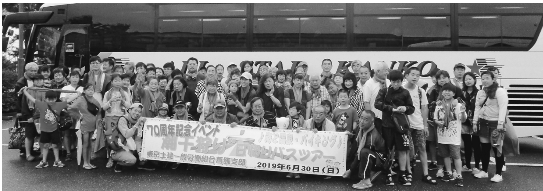
3・4号車合同の集合写真