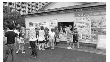
くまでと網はここで受け取り

寅さん 梅雨が明けた途端に、夏の蒸し暑さがやってきた。早速熱中症による救急搬送の報道がされている。