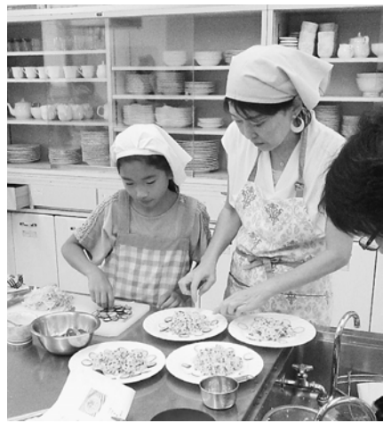
サラダ寿司の飾りつけ

7月21日(日)、葛飾支部女性の会で、親子クッキングを開催しました。会場はウィメンズホールです。3組の親子と、役員、講師含めて15人が参加しました。このイベントは、女性の会が主催する若手の会員や未加入の家族を誘うために企画しました。 今回は、「お味噌汁と乾物