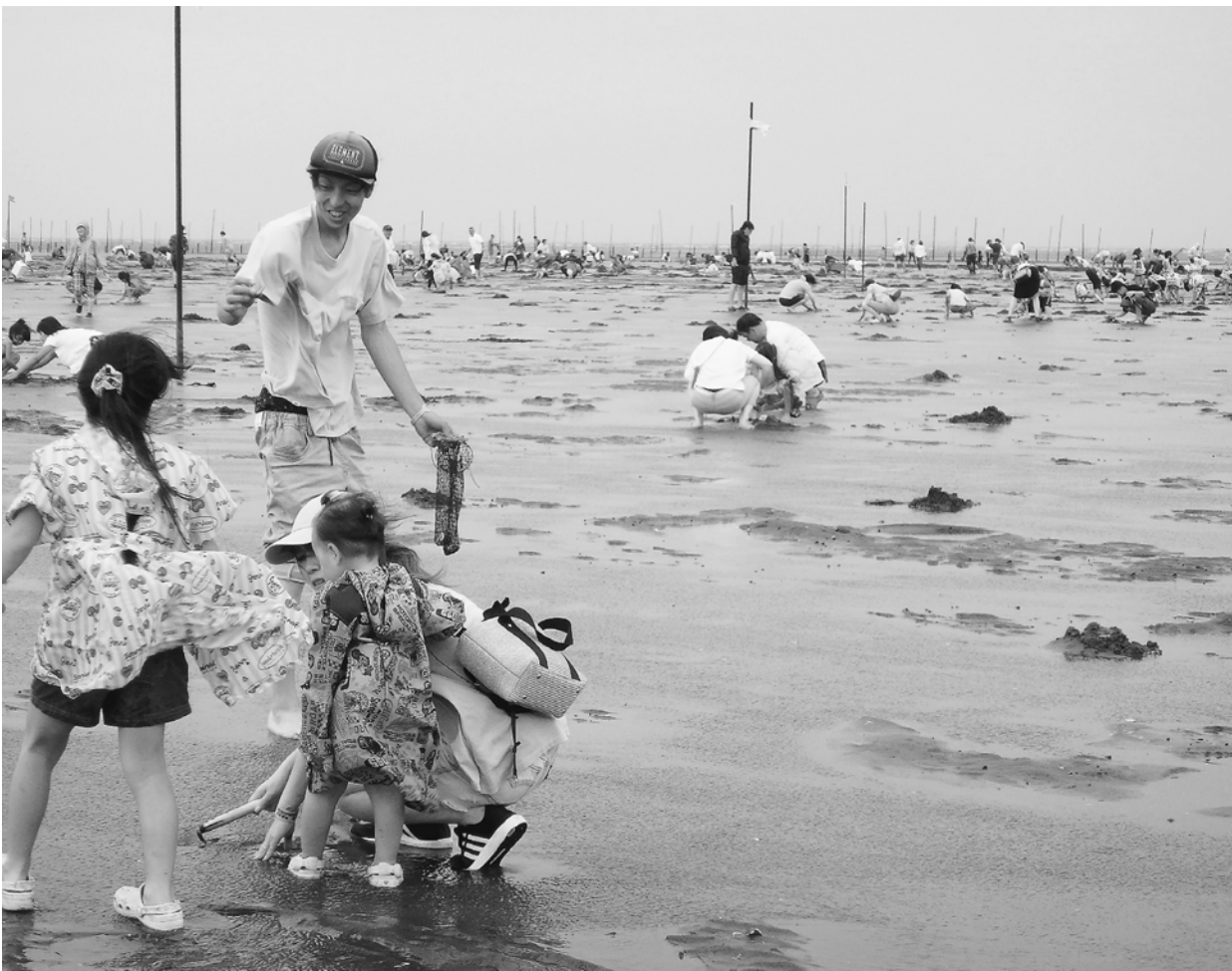
潮の引いた砂浜で、潮干狩り

それぞれに買い物を楽しんだ後、各バスは解散場所へ向かいました。大きなけがもなく、無事終わりました。