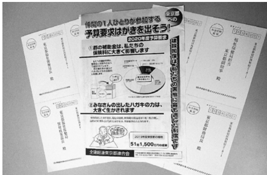
東京都宛てのハガキ

6月から始まっているハガキ要請。6・7月は厚生労働省宛てに取り組み、7月末時点で7738枚が集まりました。8月からは、東京都宛てのハガキに取り組みます。