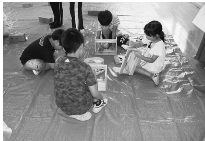
完成したら、デコレーションも

【堀切 教宣部 細貝文洋】恒例の夏の分会『工作教室』の時期になりました。7月21日(日曜日)堀切分会の組合員さんの総勢11名で、12時半から児童館に集まり、準備。児童を待ちました。 2交代制での行い、第1