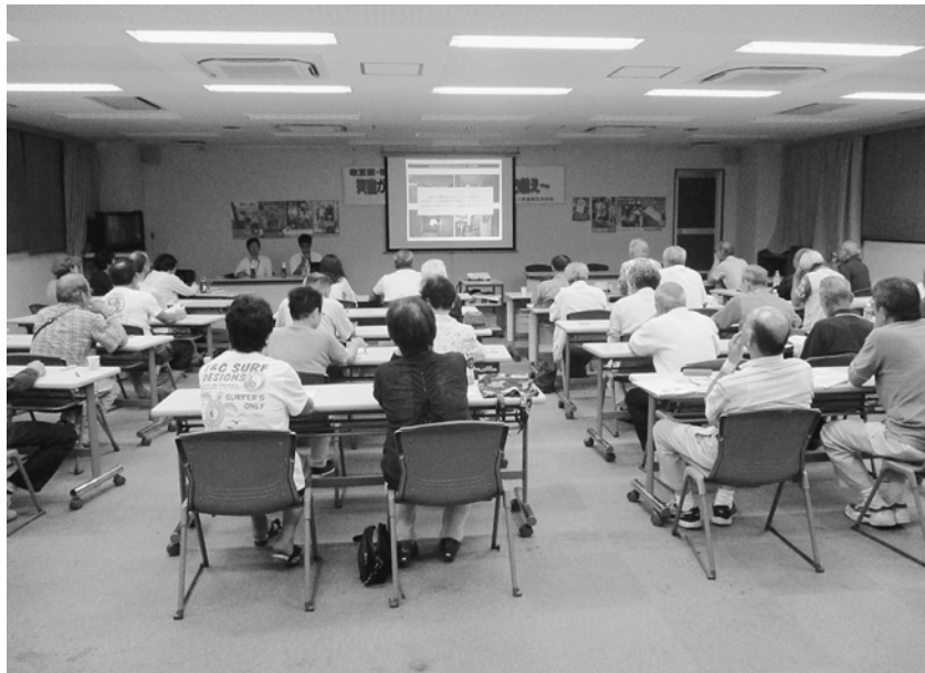
パワーポイントを利用しました