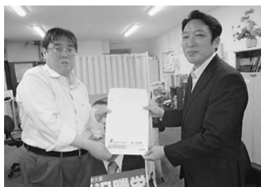
秘書の方へ要請書を

回りました。2カ所は不在、他の2カ所も議員本人は不在でした。秘書の方へ要請書を渡し、賛同への協力をお願いしました。