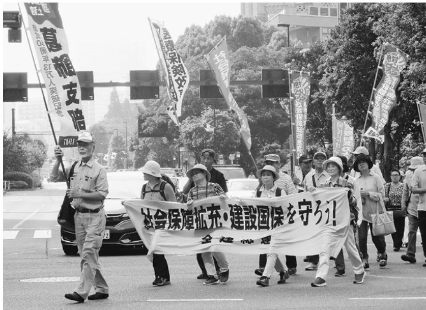
のぼり旗と横断幕を掲げて訴えました

6月26日(水)、「賃金・単価引き上げ、予算要求集会」が行われました。午前は、全都建設労働者対都要求行動です。東京都に対し、現行水準の予算の確保や補助の要請などを行います。こちらは、例年都庁や都庁近くの新宿中央公園に集合しての行動でした。今年は会場の都合により、日比谷公園に集合しての行動です。各団体や来賓からのあいさつ、基調報告が会場で行われました。最後は、資料とともに配布された個人請願書を都庁の職員の方へ手渡しました。今回は、都庁職員が会場を待機しており、各団体がそれぞれ順番に請願書を手渡しました。この時間に、交渉団は都庁に集合し、各交渉先へ向かっていました。葛飾支部から