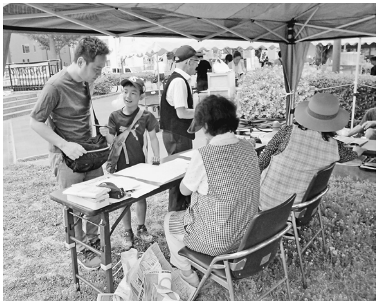
親子で工作教室へ申し込み

中央分会は、6月2日に2会場で開催しました。一つは曳舟川親水公園、もう一つは南綾瀬中央公園です。