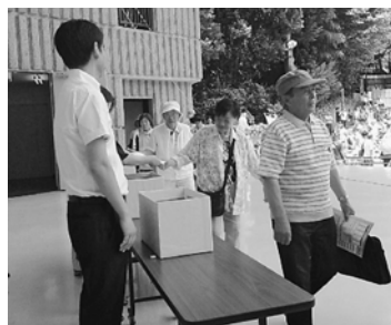
都庁職員へ要請書を手渡し

6月26日(水)、「賃金・単価引き上げ、予算要求集会」が行われました。午前は、全都建設労働者対都要求行動です。東京都に対し、現行水準の予算の確保や補助の要請などを行います。こちらは、例年都庁や都庁近くの新宿中央公園に集合しての行動でした。今年は会場の都合により、日比谷公園に集合しての行動です。各団体や来賓からのあいさつ、基調報告が会場で行われました。最後は、資料とともに配布された個人請願書を都庁の職員の方へ手渡しました。今回は、都庁職員が会場を待機しており、各団体がそれぞれ順番に請願書を手渡しました。この時間に、交渉団は都庁に集合し、各交渉先へ向かっていました。葛飾支部から