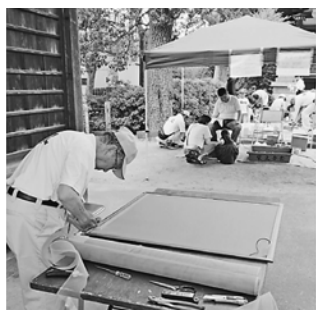
網戸張替の奥で工作

柴又八幡神社で開催しました。昨年の工作教室の反響を受けて、今年は対策も。会場の奥、神社前で工作教室を展開。会場内を見てもいい、場所も広く取れる工夫で、大勢の参加者に対応しました。