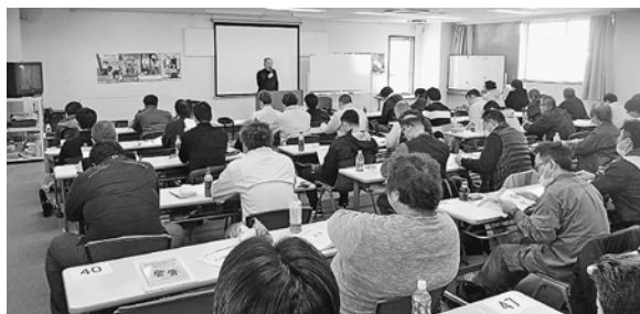
多くの人が参加しました

3月24日(日)、第2回のフルハーネス特別教育の講習会が、葛飾支部にて開催されました。 今年の2月から法律改正がされました。作業に携わるために受講対象となる人も多いためですが、猶予はあるものの上の会社から早期の受講を促される人も多いためです。