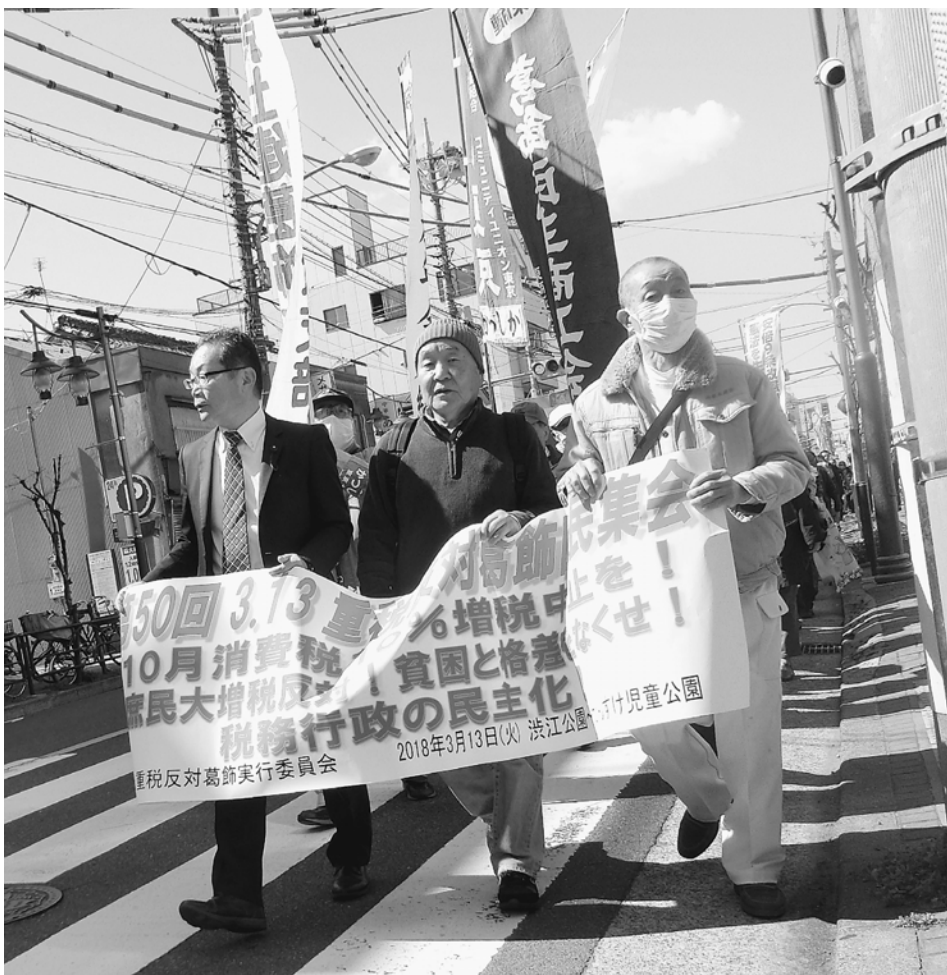
渋江公園からかんすけ公園まで元気よくデモ行進

3月13日(水)、3・13重税反対区民集会と集団申告を行ないました。集会は全体で200人、土建からは80人が参加。集団申告では250人