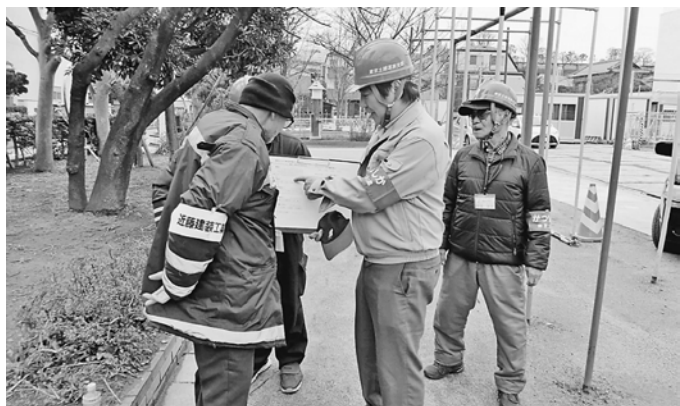
アンケートへ回答

3月6日、8日の二日間、賃金対策部では、部員と役員を中心に、葛飾区の公共工事の現場で現場実態調査を行いました。 6日はこすげ小学校外壁改修工事現場、8日は金町小学校解体工事現場で、それぞれアンケート活動を行いました。現場従事者の就労実態を捉えるため、職種や年齢、経験年数、労働時間などを調査しました。また、建退共の加入も確認し、現場での利用状況も確認しました。 これらの結果を集計し、今後、自治体交渉などに役立てていきます。