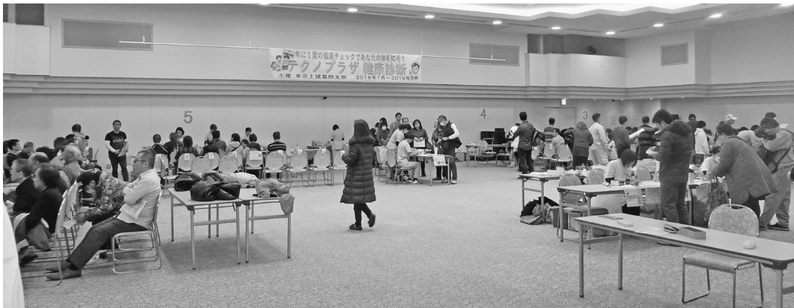
年間で最も受診者の多い健診でした