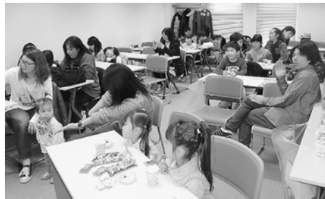
休憩スペースはいっぱい

2019年度より、新たな事業が始まりました。女性組合員を対象とした産前産後と育児休業中の保険料免除、スマホアプリで健診結果確認、対象者限定で禁煙希望者の支援、健康企業宣言です。すべての人が対象となる事業ばかりではありませんが、使えるものは是非ご活用を。クピオプラスはどげん国保加入者であれば利用できます。健康に関するイベントなどもありますので、参加してはいかがでしょうか。