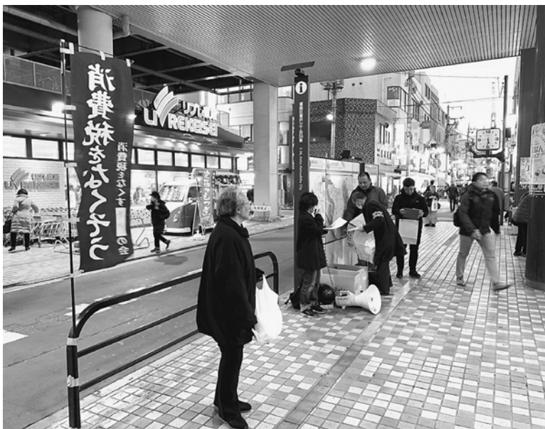
2月は青砥駅前で宣伝行動

ります。消費税10%への増税、軽減税率、インボイスが10月より導入予定だからです。これらが導入されれば、消費の低迷や事業主の事務手続きの複雑化など、国民の負担が増えることはわかっています。