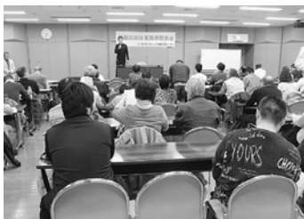
他団体との共催でした

3月19日(火)18時半、区内の四労組で協力し、シニア活動センターで学習会を開催しました。葛飾支部からは20人が参加しました。 四労組とは、葛飾区労働組合総連合・葛飾地区労働組合協議会・葛飾区職員労働組合・東京土建一般労働組合葛飾支部の4つです。これまでも宣伝などを行なっています。今回は、春闘に向けた学習会を行ないました。