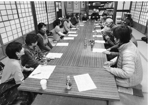
奥戸分会は天祖神社社務所にて