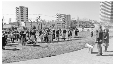
渋江公園での集会

えが続きました。今年も、消費税10%、軽減税率、インボイスと税に関する新たな制度が導入されています。これらを中止するための運動を強化していくというこ