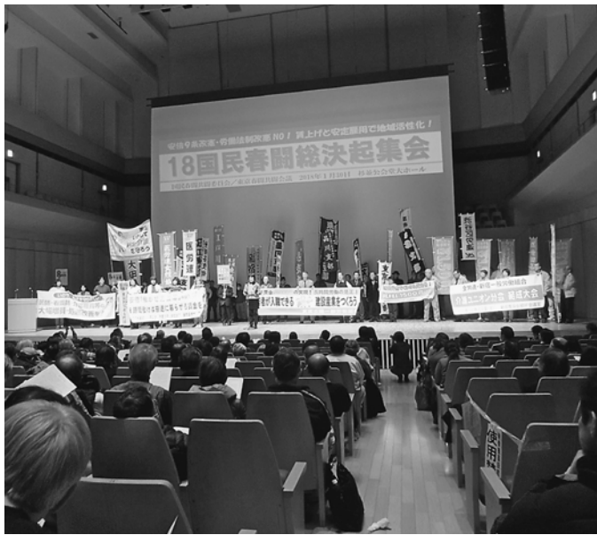
各団体代表が登場しました

2017年中の拡大は、10年ぶりの実増となりました。ご協力いただき、ありがとうございました。1月に入り、早速春一番拡大が始まりました。こちらは、3月末までの取り組みです。