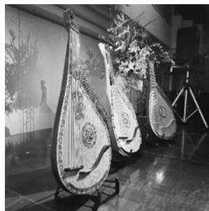
バンドウラを知ってほしいと終了後見せてくれました

コンサート終了後は、CDの販売とサイン会を行いました。美しい歌声とバンドウラの音色を気に入った方が、販売とサイン会に列を作っていました。コンサートで歌った曲が欲しいということで、どのCDにどの曲が収録されているかを熱心に聞いている人がいました。また、個別に花束を持ってきてくれた人もおり、手渡していました。素敵な演奏だったという感想を伝えて、笑顔で帰っていました。45周年にふさわしい行事となりました。