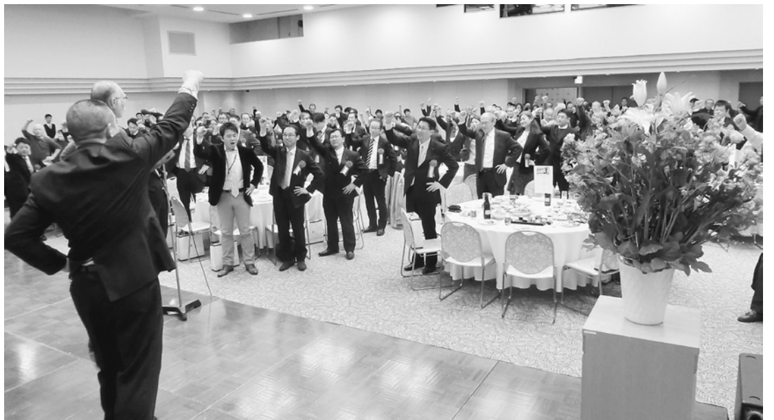
今年も一年頑張っていきましょう!