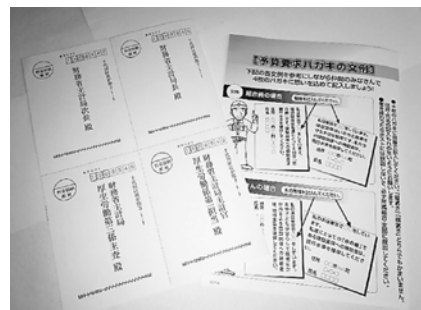
11月と12月は財務省に宛てた要請ハガキです

10月31日(火)、支部会館 訪問も積極的に取り組んでいく必要があります。訪問しても話すことがないという人もいます。そう思う人が、そういう人がアンケートの活用を。今回訪問をあまり取り組まなかったという分会は、次回の拡大で積極的に活用してください。