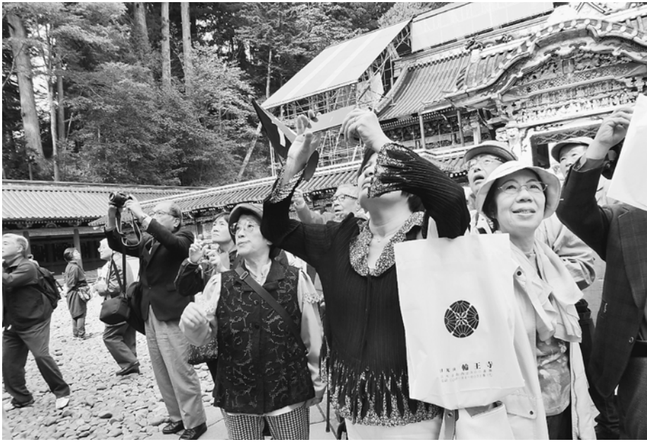
きれいになった陽明門を熱心に撮影