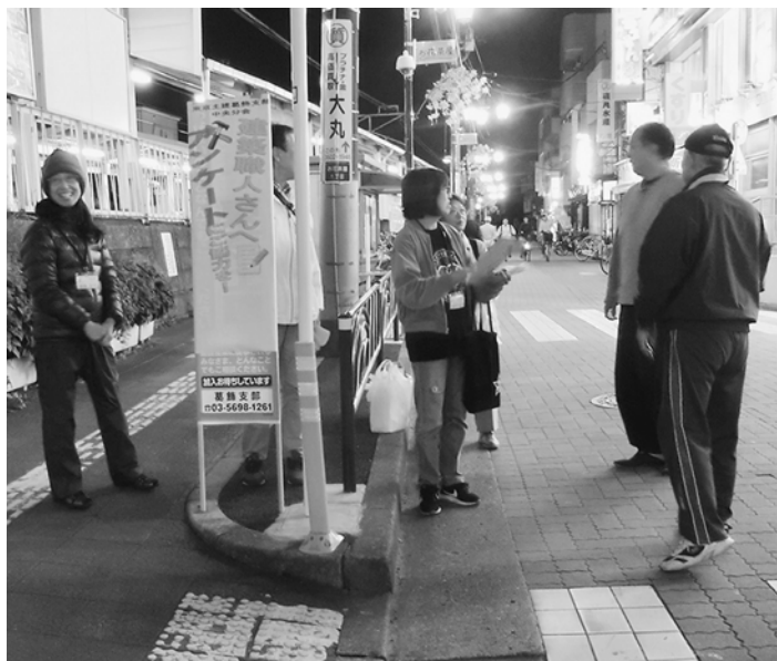
商店街の入り口で取り組みました

中央分会では、10月18日(水)にお花茶屋駅で行いました。18時頃に集まり、19時まで行いました。雨続きの天気の中、この日は雨が止み、取り組みことができました。