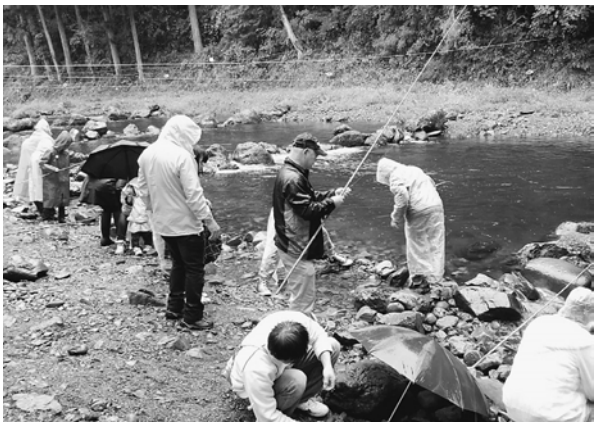
カッパ着用でつりを楽しみました

この日はあいにくの雨。ひどい降りではなかったのですが、決行となりました。参加した方はカッパを着たり、傘を差したりしながらのマス釣りとなりました。連日雨が続いていますが、川の水はそれほど増えているわけではなく、子どもから大人まで楽しみました。