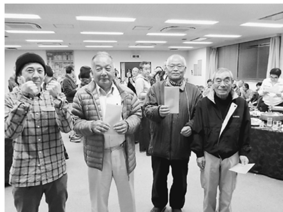
訪問アンケートの回収率、2割を達成しました!

訪問も積極的に取り組んでいく必要があります。訪問しても話すことがないという人もいます。そう思う人が、そういう人がアンケートの活用を。今回訪問をあまり取り組まなかったという分会は、次回の拡大で積極的に活用してください。