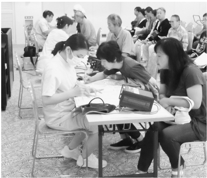
血圧や視力等、順番に受診していきます

後継者対策部では、今回も休憩所を用意。子どもを連れて健診を受けられるようにしています。60人ほどの方が利用してくれました。しかし、前年に比べるとやや利用者は少なく、連休と運動会の影響が大きいようでした。健康診断の受診率で国から