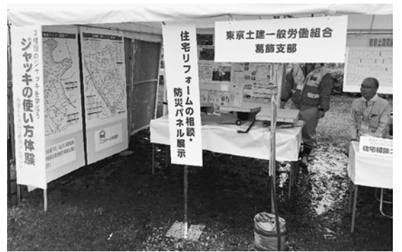
雨のため来場者は少なかったです

10月15日(日)、雨の中、葛飾区総合防災訓練・荒川下流防災施設実動訓練が行われました。メインとなった会場は堀切水辺公園。