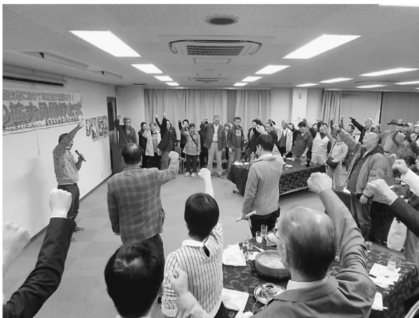
最後は、ガンパロー三唱で

この秋の拡大は、春の月間に比べると、苦戦を強いられました。春の月間は、社会保険未加入の事業所からの問合せや加入があったことや、加入している事業所からの従業員の加入により、順調に進んでいきました。秋の拡大では、この流れもかなり落ち着き、厳しい状況がありました。 支部目標の160名でしたが、残念ながら届きませんでした。秋の成果は138人となり、目標まで22人を残す形となりました。 しかし、すでに年間目標は達成しており、年間実増が見えています。2017年1月1日の現勢を越える組織人員となり、実増している分会も多くあります。分会、支部ともに実増も見えています。そ