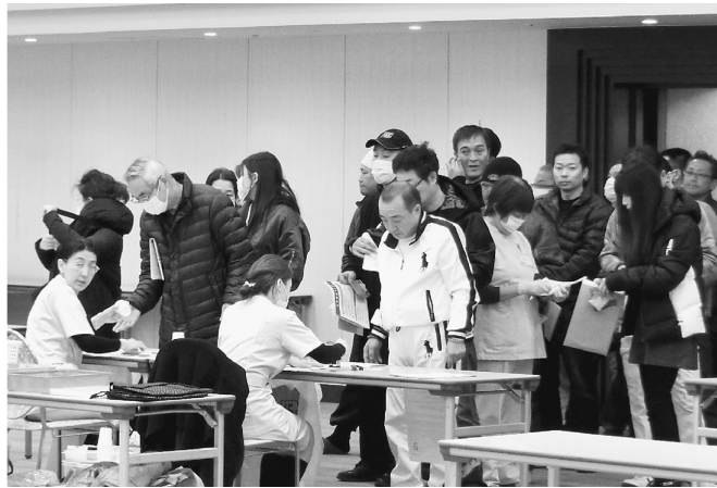
今回もたくさんの方が受診しました

2月19日(日)、今年度最後となる第3回集団健診がテクノプラザ葛飾で行われました。受診者は3335人です。後継者対策部では、今回も休憩スペースを設置。こちらは大人56人、子ども31人が利用しました。土建国保加入者は年に一度、