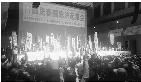
2月31日、「2017年国民春闘勝利！総決起集会」が行われました。いつもは中野ゼロホールでの開催ですが、杉並公会堂の大ホールです。主催者報告では全体の参加者は1000人、葛飾支部からは31人が参加をしました。

集会議案の提案と団結カンパロウのあとは、デモ行進です。先頭を歩く人達は、横断幕を持ち、他の人達は「賃金引上げ」「建設産業の若手育成」と書かれたボードを掲げ、日比谷公園を出発し、東京駅へ向かって元気良く行進をしました。