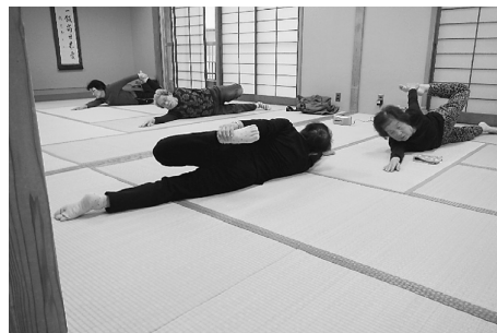
畳の上で横になり、ぐっと体を伸ばします

ヨガを始めて、三十数年になります。若い頃、70kgくらいありましたが、痩せるためのヨガではありませんでした。甲状腺のような病気に効くと聞いて始めました。丁度よく隣の町会で婦人部が開設したと聞き参加したかったのですが、当初は大人気