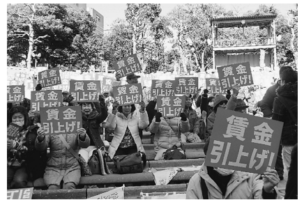
日比谷公園で掲げたこのカードを持ってデモ行進へ

2月14日(火)昼過ぎ、日比谷野音音楽堂で、「建設労働者の未来を開く2・14大集会」が開かれました。3120名が集まり、葛飾支部からは68人が参加しました。晴れていたのですが、日差しはとも暖かかったのですが、日陰は寒い日でした。 建設労働者の賃金は低く、若手の入職は少ないです。その現状を変えるために、適正な社会保険の加入が、現在国によって進められています。しかし、それに見合う賃金を得られなければ事業の継続が危ぶまれる状況です。 法定福利費の別枠支給を進めると同時に、公契約条例の制定を進めることが、賃金の引き上げや安定して働く建設業界を作るためには必要である、主催者からも、連帯している団体や各議員からも、