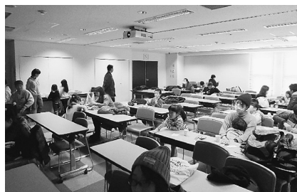
受診の休憩はこちらで

2月19日(日)、今年度最後となる第3回集団健診がテクノプラザ葛飾で行われました。受診者は3335人です。後継者対策部では、今回も休憩スペースを設置。こちらは大人56人、子ども31人が利用しました。土建国保加入者は年に一度、