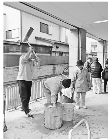
大きく振りかぶって振り下ろしてその間に入れる合の手も大変です

ルスプレーも準備。しっかりと対策をとりました。お餅つきは参加してくれた人へも声をかけ、みんな順番につきました。子どもも保護者と一緒に参加し、楽しんでいました。お餅つき以外にも、青年部主催でスマートボールという