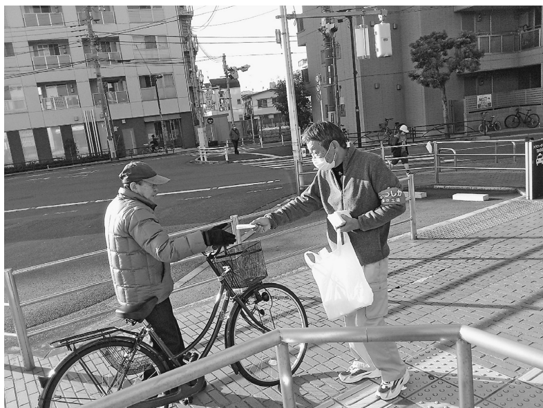
役所前での宣伝行動の様子です

毎年行っている自治体キャラバン。この取組みは、都内の全自治体に対して行われるものです。葛飾区においては1月20日(金)に、公契約条例制定や自治体臨時職員の時給UP、地元企業振興政策などについて、区の担当課長が