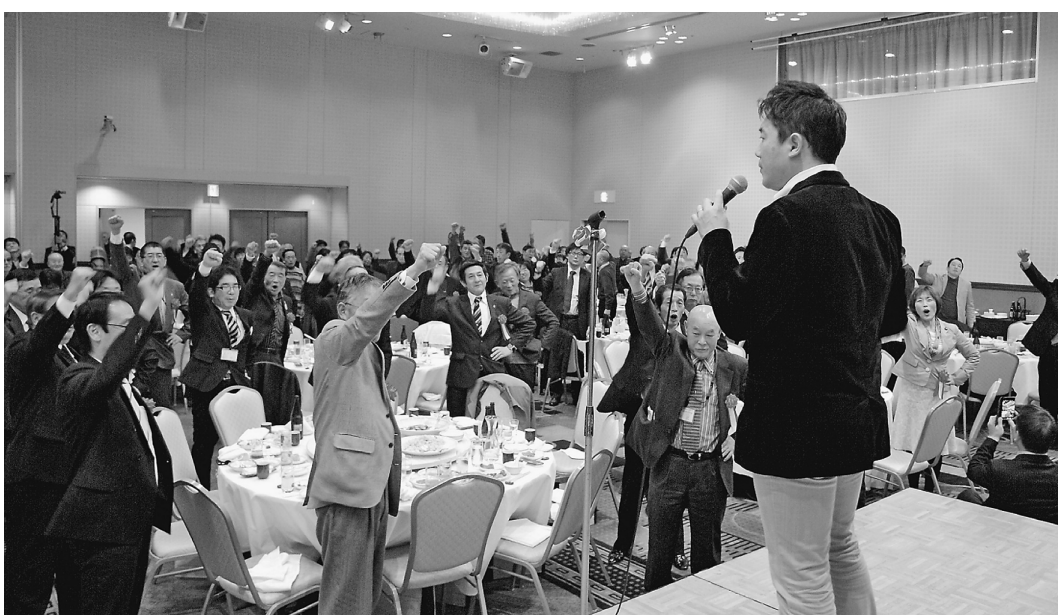
「今年一年も頑張っていこう」とガンバロー三唱をしました

年明けすべの1月6日（金）、日暮里のホテルラングウッドにて、葛飾支部の新春のつどいを行いました。例年テクノプラザで行っていましたが、都台で今回はこちらの会場での開催となりました。支部・分会、来賓を合わせ、