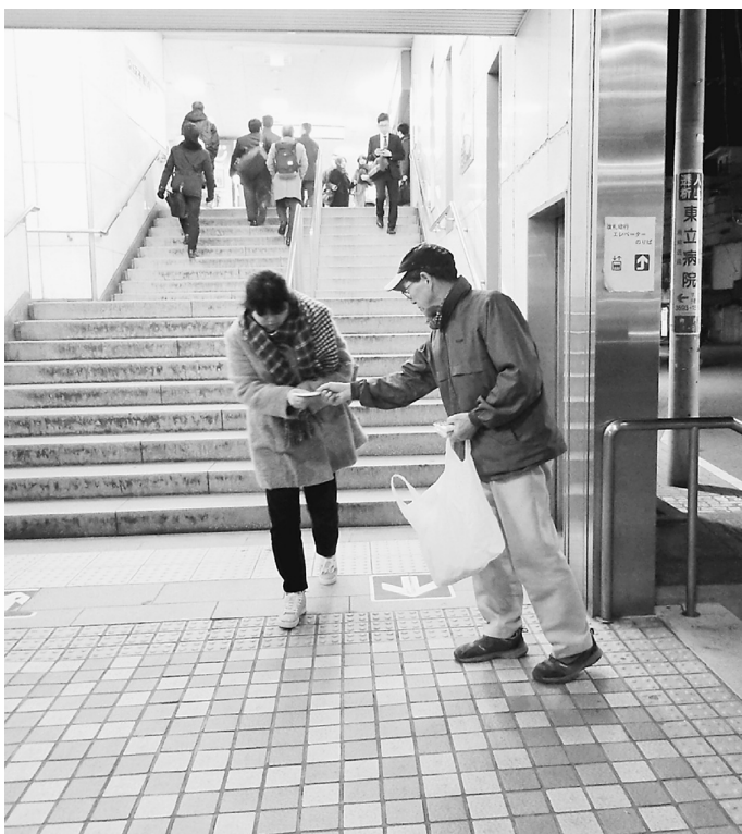
青砥駅を歩きかう人へチラシとティッシュを配っています

調査を重ねることで、賃金実態がわかります。私達が毎年取り組んでいる賃金アンケートの結果の通りであれば、設計労務単価との隔たりは大きいはず。これを区がどう解釈するのかが、これからですが、これは、条例制定に向け大きな一歩となる取組みとなります。