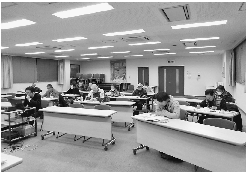
説明を聞きながら、例題を解いていきます。初めて参加の方も資料やテキストなどを参考に挑戦しました