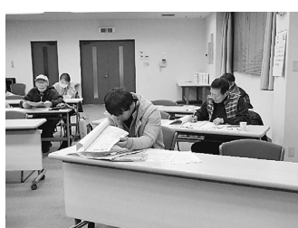
配布物は参考になります

1月24日(火)、葛飾支部3階にて19時半より、確定申告学習会を行いました。参加者は18人。そのうち、5人が今年初めて確定申告をするということでした。