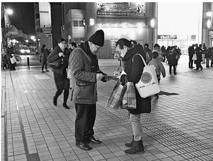
寒い中、立ち止まって署名のご協力ありがとうございます

税金対策部では、毎月定例で消費税廃止を訴える駅頭宣伝と署名活動を行っています。行うのは毎月24日前後。葛飾区内の駅頭で、他団体と協力して訴えています。 夕方頃から部員が集まり、ティッシュにチラシを折り込