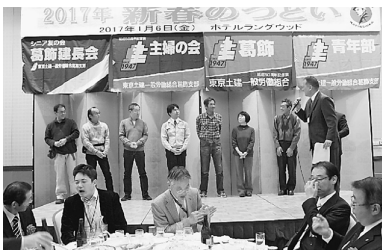
実増した分会から一言ずつもらって、報奨金を渡しました