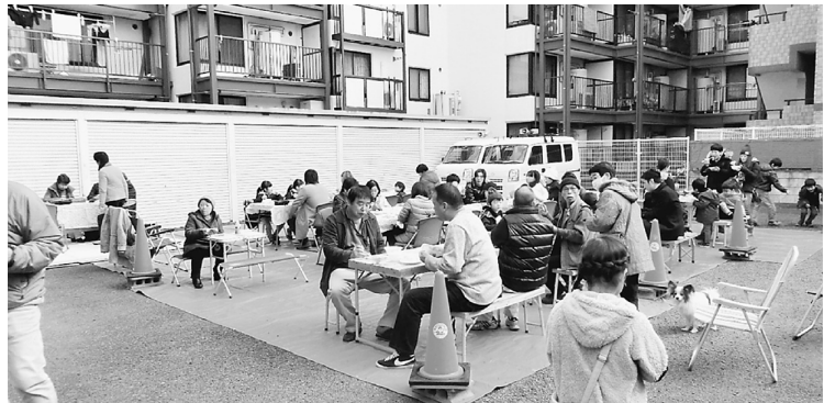
ゆっくり座って食べられるようにいすとテーブルを用意。左端では女性の会の手芸コーナーがありました

1月29日(日)、葛飾支部会館の駐車場を利用し、餅つき交流会が開かれました。参加者は150人でした。当日はいいお天気で、暖か