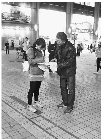
小学生も署名に協力 隊に入隊し

2016年12月21日、亀有駅で2回目の4団体共闘による駅頭宣伝を行いました。葛飾区労働組合総連合、葛飾地区労働組合協議会、葛飾区職員労働組合と東京土建葛飾支部の4団体で共同の駅頭宣伝です。葛飾支部からは4人が参加しました。6月に行った初の共闘は「戦争法反対」を訴えました。今回は「ストップ！戦争する国づくり 自衛隊は南スーダンから今すぐ撤退を」と訴えました。