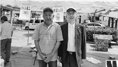
▲青木区長も来てくれました。(東水元分会)