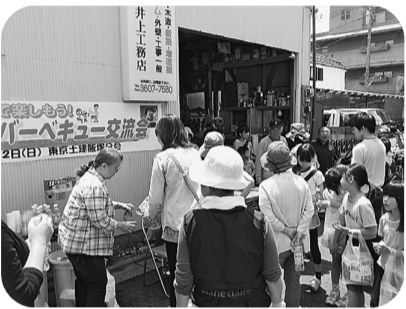
大人だけでなく、子どもも楽しみにしてくれています