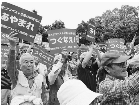
「あやまれ」「つくなえ」プラカードを掲げて、訴えました

「あやまれ」「つくなえ」プラカードを掲げて、訴えました。その後、ゆりかもめに乗って太平洋セメントへ移動し、包囲行動を行いました。責任を認め、被害者への謝罪と補償を行うこと、建設アスベストの基金の設立をすることを求めました。参加者もカードを掲げて訴えました。