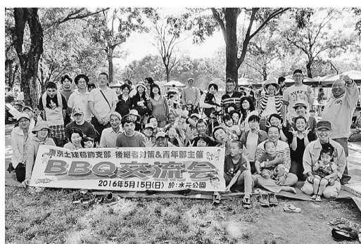
今年も水元公園にたくさんの人が集まりました

よく晴れて気温が高いけれど、風はさわやか。絶好の行楽日和だった5月22日、女性の会ではバスレクを行い、67人の参加で、高尾山へ。