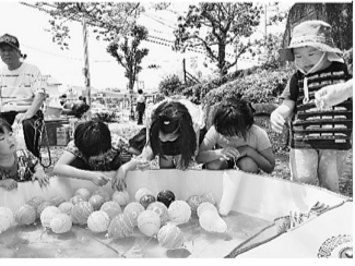
▶暑いから子どもたちも集まりました。(飯塚分会)