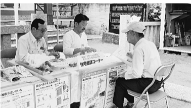
▲住宅相談を受付中(立石分会)