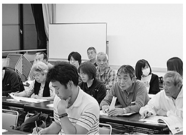
真面目に学習する役員さん

今年の1月から個人番号(マイナンバー)制度が始まりました。それによって、健康保険の手続き時に、個人番号が必要になりました。どうしても個人番号を提出したくないという人は支部にご相談ください。