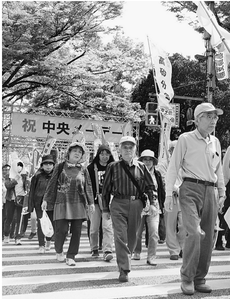
ようやくのデモ行進元気よく歩きました

晴天の5月1日(日)、第87回中央メーデーが代々木公園で行われました。全体の参加者はこれまでを大きく上回り、3万人を超え多いということです。葛飾からは195人が参加しました。日曜日の