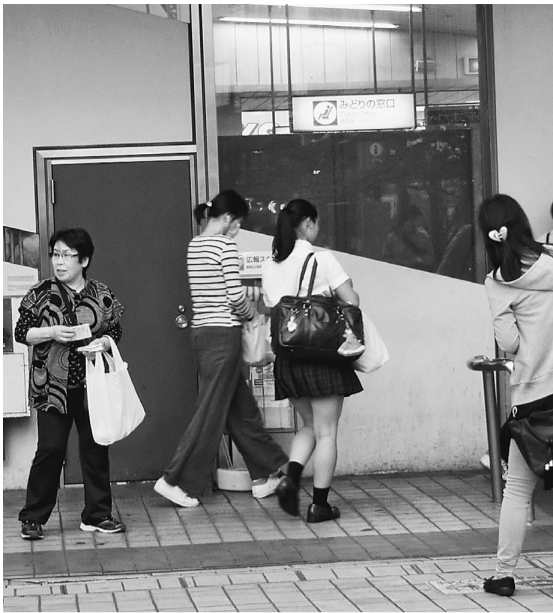
亀有駅での宣伝行動は女性陣が大活躍でした

1年後の2017年4月に消費税を10%に増税すると安倍・自公政権は考えています。それに対し、5月24日、「重税反対葛飾実行委員会・葛飾社会保障推進協議会」が葛飾区内にある13駅全てで増税