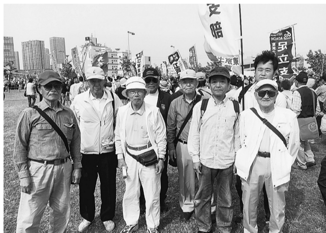
東京臨海広域公園に集まった葛飾支部のみなさん

5月3日憲法記念日、安保関連法案が可決・施行されてから初めての集会となり「平和」とのちと人権を！5・3憲法集会 明日を決めるのは私たち」と東京臨海広域防災公園に5万人と