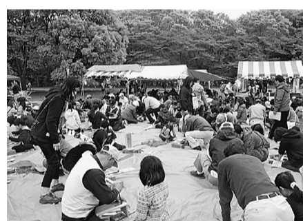
いまいちの天気でもたくさんの方が集まりました

いました。よく晴れた青空の下、たくさん子どもたちが来てくれました。本立てとプラントーは150ずつ、銅版は100を用意しました。受付を開始する前からずらりと人が並んでいましたが、最初は例年よりも人が少なめ。午後の分まで十分かと思っていました。14時には持ってきたすべての材料がなくなり、いつものおりの盛況でした。何人かの方から、「もうないの？」や「毎年来ていて、来年も楽しみにしている」との声をかけてもらいました。