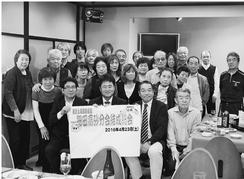
一つの分会になりました。これから協力して頑張ります