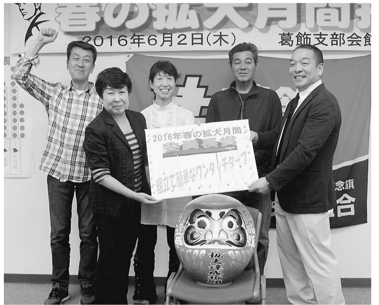
委員長賞のテントが二葉分会に贈られました

4月15日の出陣式から始まった春の拡大月間。葛飾支部の目標は163人で、179人で達成、16人の超過です。今回のスタートは好調。出陣式の日以西新小岩分会と本分会が達成するという、勢いのある始まりでした。前半の加入者の多くは事業所からです。社保未加入問題を抱えた事業所や、現場に入るために雇用保険や労災保険が必要になった事業所からの相談が多く見られました。しかし、これは一時的なものです。5月の連休明けからは、勢いが落ち着いていました。5月11日に中間決起集会を行いました。