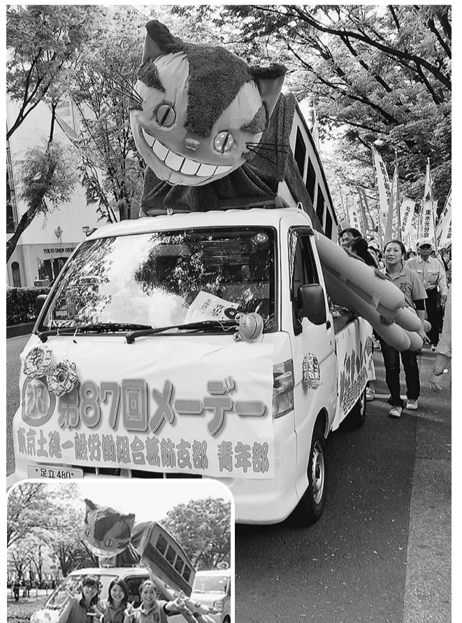
▲今回のメーデーデコはネコバスでした。さわり心地もばつぐんです！ ◀女性陣が頑張りました

残念ながら受賞はできませんでしたが、道行く人々からは高評価でした。受賞を逃した理由は審査員へのアピール不足。反省点を踏まえて、「来年こそは賞を取る」と意気込みを見せてくれたので、来年が楽しみです。ただ、女性中心になると、どうしても製作が思うように進まないことも…。もともと人手不足もあるので来年は製作の時も、アピールの時も、ぜひみなさんの力を貸してください。求む！男手！