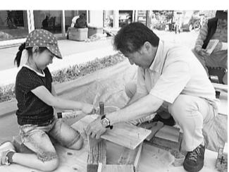
▲慣れない手つきでがんばりました。(東金町分会)