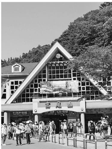
朝からたくさんの方が訪れていました