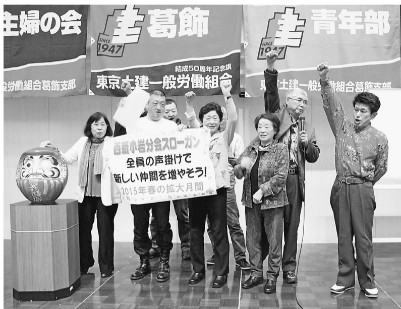
出陣席で達成した西新小岩分会 超過達成を期待します

みんなで取り組もう 春の月間 拡大出陣式で西新小岩分会が達成一番乗り 公契約条例実現、賃金引き上げや土建国保を守るなどの要求をかかげた「春の拡大月間」が4月から始まっています。4月14日(火)テクノプラザかつしかにて、支部・分会役員一同が集まり拡大出陣式が行われ、180人が参加