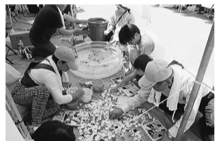
写真は昨年の住宅デーの様子、今年もたくさんの方を集めましょう