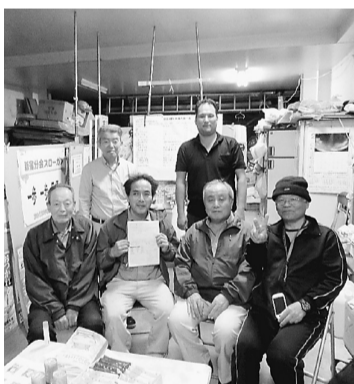
4月27日の行動で国保加入を希望していた対象者が加入し目標の5人を達成しました

今回の春の拡大月間では、①新年度役員学習を成功させて、分会活動を軌道にのせ、拡大運動を推進する。②仲間との対話・相談を最重点に取り組み、拡大する力を育てる。③労働保険年度更新を利用している対象者の掘り起こし、社保未加入対策を強める。など、近年建設現場で社会保険や一人親方労災などの適用が強化されており、組合への問い合わせや相談が増えている。このこと、これら建設従事者の方たちの相談に対応することや、賃金・単価の引き上げと建設産業の適正なルールづくりなどをかかげ5月末まで取り組みます。