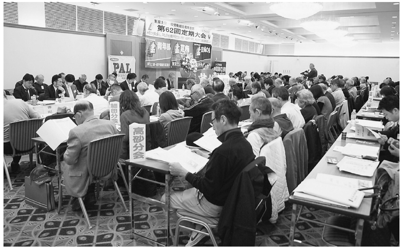
会場は江戸川区のグリーンパレスにて行われました