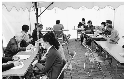
いろいろな相談を受けました