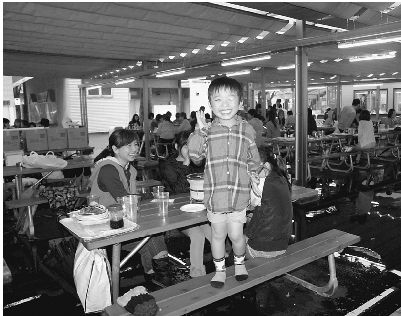
乗り物には乗れませんでした。子どもたちは元気でした。

支部65周年行事の目玉でもある「としまえんへ行こう」が10月5日(日)に行われ、この日は台風18号が関東にも接近していたため朝から雨が降っており、不安の中5台用意したバスに乗り込み