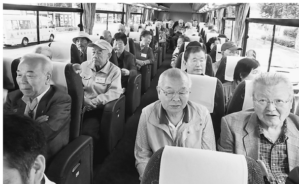
来年も元気で会いましょう

休憩を行い最初の見学場所である誕生寺では、たったの15分くらいしか見学・参拝ができずあっという間に終了。すぐにホテルへ向かい、天然温泉に入ったあと昼食となり、ここでも元気の建長会のみならず、カラオケも大変楽しく行われました。帰りのバスでは一瞬だけ静かにしていましたが、すぐに元気を取り戻しピニング大会で盛り上がり、あまりの楽しさに最終休憩地となった海ホテルパーキングでは行方不明者が。しかし無事見つかり夕方6時には支部へ到着、何名かはそのまま当日行われた支部中間拡大決起集会に参加したのでした。