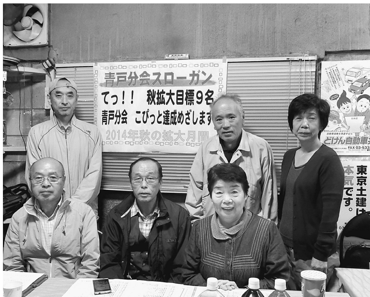
青戸分会は9人の目標を一番で達成しました

定年制実現も向け後継者の発掘をして土建国保を守り抜く拡大を実現しよう」「仕事と生活を向上させる組織づくり、町づくり、人づくり、そして新しい仲間を獲得しよう」「新たな仲間、新たな活動家を見つけ、65年度の拡大も成功させよう」魅力ある組合、魅力ある支部、魅力ある人を目指し秋の運動を成功