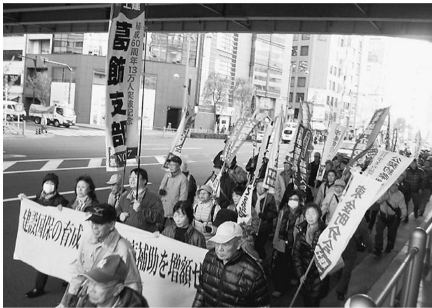
日比谷公園から東京駅までデモ行進