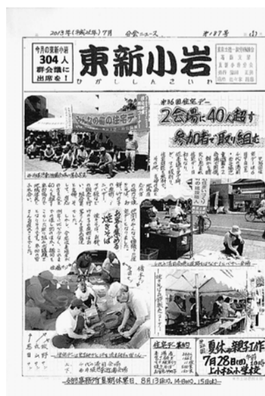
東新小岩分会新聞7月号

京土建全体で233紙の応募 があり、その中から39紙が入 賞です。 葛飾支部の中でも、まだ発 行していない分会が約半数あ ります。教宣部では多くの分