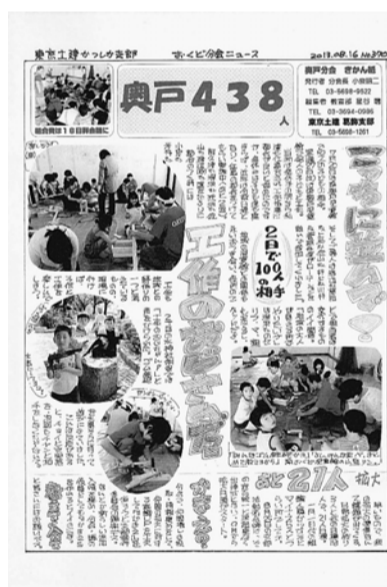
奥戸分会新聞8月号

結果、葛飾から応募の東新 小岩分会新聞・奥戸分会新聞 が見事入賞し、特選紙に輝き ました。おめでとうございま す。葛飾支部からは入賞の2 紙をはじめ、9紙の応募、東