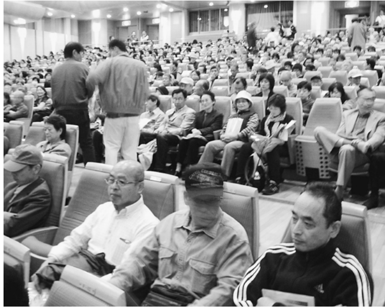
ティアラこうとうに36人が参加 したまち憲法の集い