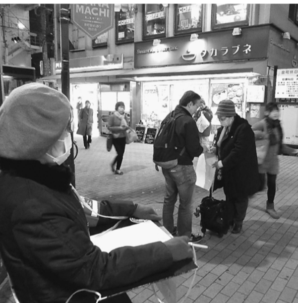
増税反対の声に賛同し署名(金町)

なる(朝日)」「家計襲う三重苦」増税、物価高、社会保障費(東京)の各新聞社の指摘のとおり国民生活に大きな打撃となります。そんな消費税増税を許すまいと11月22日(金)夕方から立石・亀有・金町の3駅で消費税増税反対の駅頭宣伝行動を行いました。参加者は11団体68人(土建からは36人が参加)。