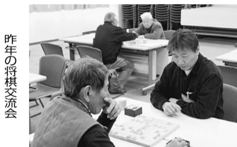
昨年の将棋交流会

今回ウォーキング大会にご参加いただいた方、運営にご協力いただいた方、本当にありがとうございます。