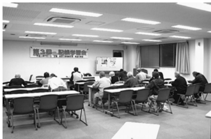
記帳学習会に18人が参加

ティッシュとチラシを配布し、街ゆく人へ訴えました。消費税は私たちの生活に直結する大きな問題というところもあり、用意したチラシ・ティッシュ3800個は全てなくなり、署名も149筆集まりました。