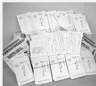
集まった財務省宛要請ハガキ

11月20日にかけての財務省へのハガキ要請行動は組合員さんと家族を含めた、みんなで出来る運動と位置づけ取組んでいます。 7月から続いている私たちの運動の成果で、厚生労働省は、「国保組合補助」として3200億7千万を