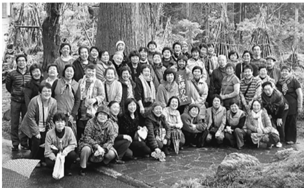
50人が参加の主婦の会1泊旅行

上越新幹線が開通しスキ リゾートとしても栄え、昔な がらの温泉地と近代ホテルが 共存の温泉町となった湯沢。 雪景色にはまだ早く雪国独