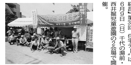
開場前に記念撮影(東新小岩)

【東新小岩・教宣・佐々木経昌】第36回住宅デーは、6月9日(日)千代の湯前・西井掘児童遊園の2会場で開催。 朝から晴天に恵まれ住宅デー日和となり、従来の包丁研ぎ、まな板削り、住宅相談を無料で、その他、主婦の会と地域有志の方の協力で焼きそば、お餅、筍の煮物、ミニパザー、まな板などの販売を行い、組合員と主婦、そして、有志の方を交え40人を超す参加協力で地域住民とふれあいい、仲間のみんなと頑張った住宅デーとなりました。 今年も例年同様、来場者が少な〜〜これまでに催し物のほかに、趣向をこらした取り組みが課題となりそうです。参加の皆さんお疲れさまでした。