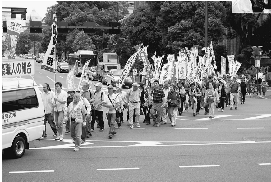
銀座を通り東京駅までデモ行進