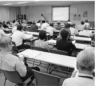
住宅相談員学習会

晴天に恵まれた6月9日(日)。葛飾区から後援を受けた第36回住宅デーを区内34会場で開催。 実行委員会を2回、住宅相談員学習会を直前に開催し、この日に備えてきました。 各会場で工夫をこらした取り組みで来場者を迎えまし