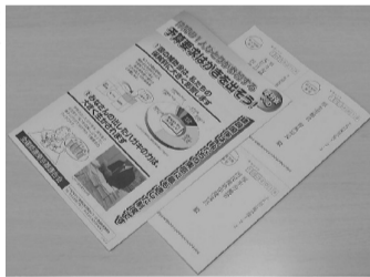
要請ハガキ(7~8月の取組み)

土建国保の14年度向け予算要求の闘争が、7月3日の予算要求集会を皮切りに始まります。毎年の取り組みではありませんが、ご協力をお願いします。今年度の保険料は昨年の取り組みの成果から、一昨年とほぼ同等の保険料になっていきます。 厚生労働省へのはがき要請、国会行動、国保予算集会、省庁交渉などを強化して行なうことで国庫補助の現行水準確保に全力をあげていきます。みなさんも一緒にご自身の健康保険を守るために協力をお願いします。