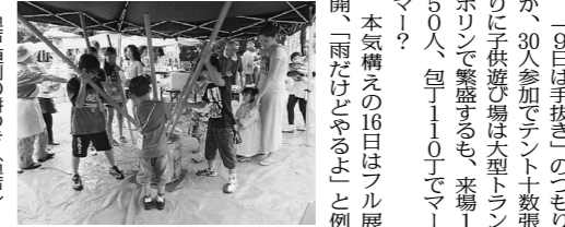
奥戸恒例の餅つき(奥戸)

【奥戸・教宣・泉谷聰】奥戸分会の住宅デー、9日は地元小学校の運動会で来場者の大幅減が明らか、翌週開催も打診したが認められず。 「9日は手抜き」のつもりが、30人参加でテント十数張りの子供遊び場は大型トランポリンで繁盛するも、来場150人、包丁10丁でマーマー？ 来場者は250人程度に。包丁96本、まな板6枚で肩すかし、後日「あの雨でもあったの、行けばよかった」と何人も言われ、当日の宣伝方も次回は回すから。 「餅、食べる？」来場者が今イチのお陰で仲間にも餅が届く。「餅つきした子は優先的にあげますよ」とカードを前に、買物券無くてもイイヨ食べて「イベントは面白くない」と大笑い。 「初の2週連続、楽しくやれて良かった」と反省会で。それなりに、地域でも認められてきた実感を感じていると、仲間の皆さん「次は晴れるよ」と元気に撒収。