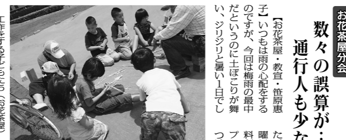
工作をする子どもたち(お花茶屋)