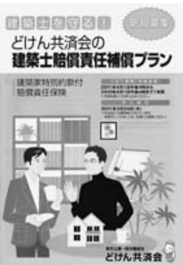
新しくできた建築士賠償責任保険のパンフレット

2007年6月に施行された改正建築士法により、「建築士事務所」の開設者は、設計等を委託しようとする者の求めに応じ、結成等の業務に関し生じた損害を賠償するため必要な金額を担保するための保険契約の締結その他の措置を講じている場合に於ては、その内容を記録した書類を閲覧させなければならぬ(第24条の6)とされています。そんな中、今までの保険の取り扱いには、建築士関連の団体に加入した上で、保険に入る事が出来ましたが、東京土建で、組合員向けに窓口を広げることができました。