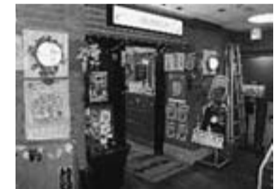
金町の【歌うんだ村】

【家庭的で明るい店。刺身が新鮮でうまい!】 ・サービス：飲食代お会計時に10%OFF (他のサービスとの併用はできません) ・住所：金町6-4-1 金町木下ビル2F ・電話：03-3627-6321