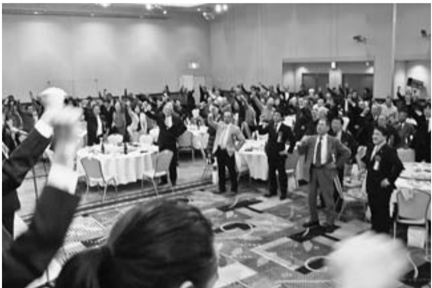
旗びらき最後に参加者全員でガンバロウ三唱をしました