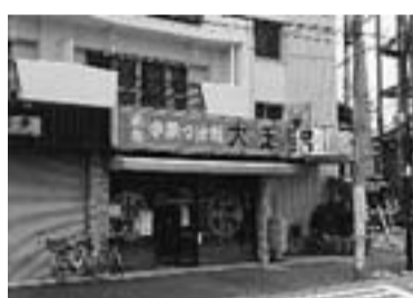
東新小岩の【つけ面大王】

【12席あるお座席と早朝4時まで営業中】 ・サービス：餃子半額 450円が225円に ・住所：東新小岩5-14-1 栄コーポF1 ・電話：03-3696-6496