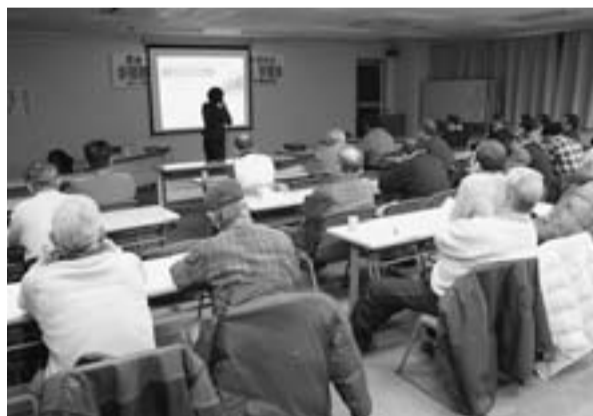
36人が参加した労働者性問題の学習会

脱退防止につとめ 組織人員の回復を 11年も始まり今年も組合員を増やす取り組み行動が始まりました。昨年は、不況・就業実態調査などにより、大きく組織人員を減らす結果となりました。今年も引き続き就業実態調査など大変な取り組みを年度末まで行うことになり、脱退の防止に努め、組織人員の回復をめざしていきます。 1月は統一行動日を設けませんでした。2・3月は、それぞれ2日間ずつの行動日があります。