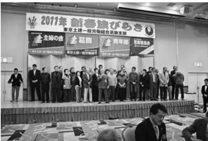
年間実増を果たした4分会のみなさん(本田・柴又・北水元・幸田)

以上詳細は支部執行委員会を通じて分会にお知らせし、不明の点は大会事務局までお問合せください。