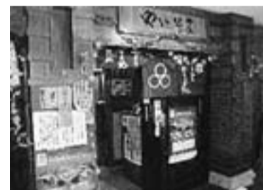
金町の【やるき茶屋】

【12席あるお座席と早朝4時まで営業中】 ・サービス：餃子半額 450円が225円に ・住所：東新小岩5-14-1 栄コーポF1 ・電話：03-3696-6496