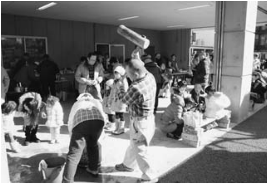
モチのつき上がりを待ってる人のためにも一生懸命ついています