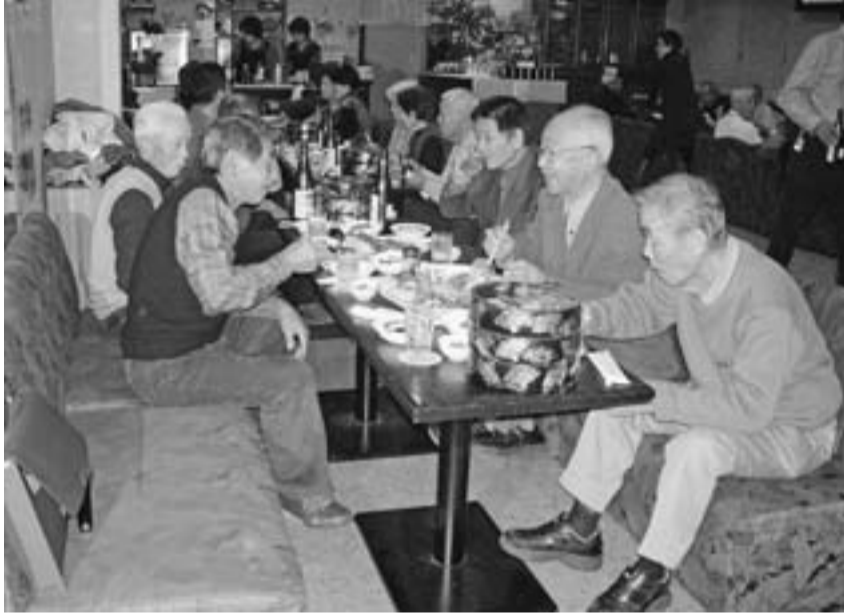
新加入者が2人参加の東新小岩分会の新加入者歓迎会

口上もファンに親しまれていました。 テレビがきっかけ ロングシリーズに 実は、「男はつらいよ」は、テレビドラマの人気から映画撮影されるに至りました。昭和43年から44年にかけて、フジテレビが制作・放送したテレビドラマが最初でした。知ってましたか？ 柴又帝釈天、寅さん記念館 はもちろんなこと、とらや(撮影当時の屋号は、柴又屋)が、初期の頃、撮影に使った和菓子店や、高木屋(映画撮影に積極的に協力していただんご屋も、柴又駅前からの参道にあります。久しぶりに足を運んでみるのも良いかもしれませぬ。