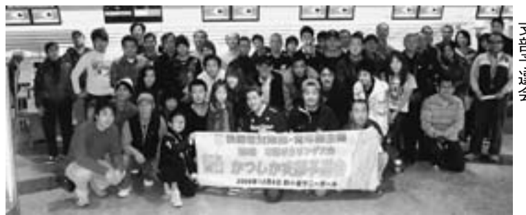
本部大会2連覇めざして支部予選会

なお、青戸分会はオブザーバー参加のため、本部大会には正式参加1位の柴又分会に本部大会連覇を託して要請しました。