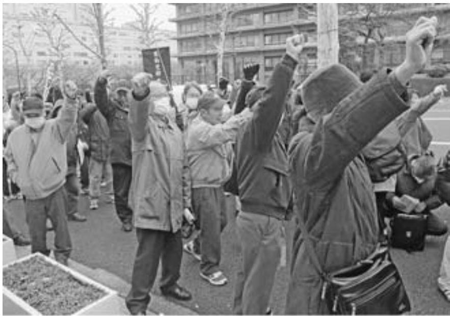
『仕事よこせ 職よこせ』とコブシを突き上げる葛飾の仲間 国土交通省前