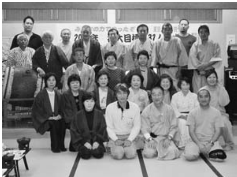
11月29・30日に小名浜へ打ち上げのバス一泊旅行 幸田分会

【幸田分会・教宣部・伊藤兼夫】「支部結成60周年を6000人で迎えよう」秋の拡大統一行動。幸田分会は9月の段階で年間残目標18人。目標達成出来るのか？ 掛け声は聞こえるが、分会の誰もが「今年の拡大は目標が大きすぎる到底無理だろう」と、考えていたに違いない。 既に春の拡大で出さずに出した後である。未加入対象者の掘り起こしも皆無に等しい。ここ数年拡大目標はどうかクリアしてきた。ここで負けるわけにはいかない。 分会の組織部長を中心に役員が集まり策を練る。「拡大は仲間のつながりで！」を合言葉に。拡大目標をやり切り、美味しいお酒を飲もう。打ち上げはバスで一泊旅行がいい。組織部長が旗を振り、拡大の戦いはスタートを切った。 スタートはしたものの、苦戦の連続である。そうした中、1人、2人、3人、5人と続き、支部の協力も得ながら二桁の加入者となる。残り8人。 打ち上げのバス一泊旅行も準備が忙しくなる。ネットに詳しい役員が、安くて料理の美味しい旅館一件を丸ごと借り切る事が出来たようだ。これは凄い事だ。さあ、打ち上げの準備は整った。残るは拡大目標達成すること。終盤で目標の18人達成。打ち上げも盛大に。 海ともみじの綺麗な常磐道沿線を小名浜へ向け、25人を乗せたバスははしる。(11月29・30日)