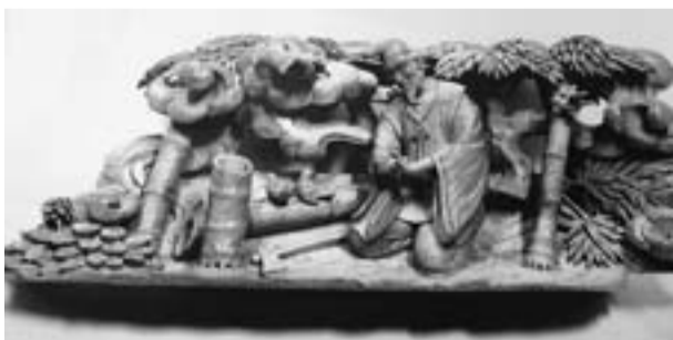
現在作成中の竹取物語の1場面