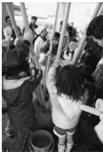
子どもたちで餅つきを楽しみました